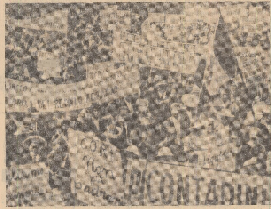
La Roma a avut loc zilele trecute o mare demonstrație a muncitorilor agricoli și țăranilor din diferite regiuni ale Italiei. Această demonstrație s-a înscris în campania pe care o duc pe plan național țăranii italieni, care luptă pentru înlăturarea unei reforme agrare și pentru îmbunătățirea situației muncitorilor agricoli și micilor producători din agricultură. În fotografie: aspect de la demonstrație.

NEW YORK. La New York a fost dat publicității un raport pregătit de Organizația Națiunilor Unite pentru problemele învățămîntului, științei și culturii (UNESCO) cu privire la situația analfabetismului în lume. Potrivit datelor raportului, în prezent există în lume peste 700 de milioane de analfabeci, ceea ce reprezintă o gravă amenințare pentru creșterea nivelului de trai al populațiilor. Faptul că majoritatea analfabeților sînt femei, continuă raportul, are consecințe deplorabile pentru viața umană și educația copiilor.