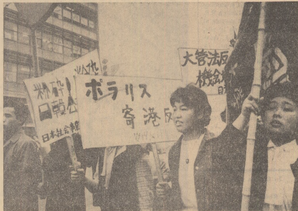
În Japonia se desfășoară acțiuni de masă în sprijinul păcii și dezarmării, împotriva înțării în porturile țării a submarinelor atomice ale S.U.A. și staționării pe pământ japonez a avioanelor „F-105” purtătoare de bombe atomice. În fotografie: aspect de la o asemenea acțiune — o recentă demonstrație a studenților din Tokio.

LONDRA. Aproximativ 1000 de participanți la „Miscarea pentru dezarmare nucleară” din orașul Exeter au desfășurat la 3 iunie un marș spre locul unde este situat cartierul general secret din regiunea Devon (Anglia de sud-vest), pregătit de guvernul englez în caz de război. Polițiștii au barat calea participanților la acest marș spre cartierul general, amenințându-i cu arestarea dacă vor încerca să pătrundă prin gardul de sîmna ghimpată.