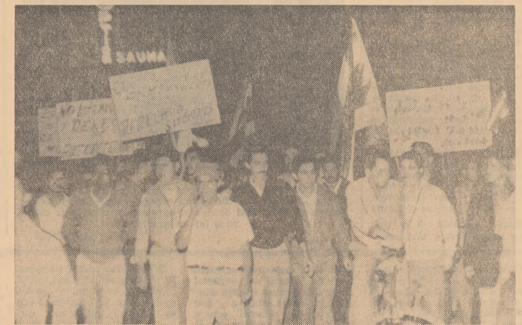
Oamenii muncii din San Jose (Costa Rica) au organizat o demonstrație în cursul căreia au cerut dezarmarea generală, lărgirea drepturilor sindicale, îmbunătățirea situației muncitorilor și a funcționarilor costaricani, renunțarea la orice armec stec nord-american în treburile interne al țării lor. În fotografie: Aspect din timpul demonstrației.

Totodată agențiile de presă relevă puternicul val de proteste provocat de încălcarea legilor internaționale de către vasele de pescuit nord-americane. Ambasadorul statului Chile în Ecuador, Sergio Hunes Lavin, a declarat, după cum anunță agenția Prensa Latina, că pescuitul ilegal în apele teritoriale ale altor țări, efectuat de către navele nord-americane, atentează la suveranitatea acestor țări. Un protest asemănător a fost formulat și de atașatul comercial al statului Peru în Ecuador, Orville Perez Villarroel, care — după cum menționează agenția Prensa Latina — a anunțat că este posibil ca Ecuadorul, Peru și Chile să „întreprindă acțiuni comune împotriva navelor pescăresci care pescuiesc în mod ilegal în apele teritoriale ale acestor țări”.