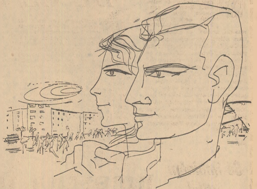
Desen de TIA PELTZ