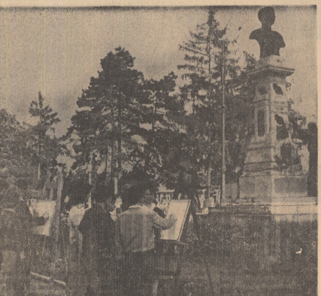
Elevi ai Școlii populare de artă din Brăila, în timpul unei ore practice în aer liber.