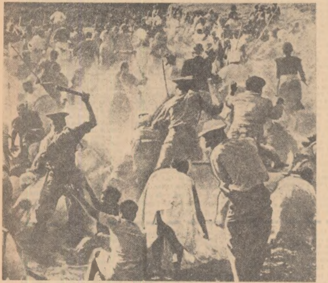
Guvernul rasist al Uniunii Sud-Africane intensifică reprimiile împotriva populației bălinoase, de culoare. În centrul astfel să îndușe lupta tot mai dură pe care o duce populația de culoare pentru drepturile sale, împotriva discriminării rasiale. În fotografie: poliști din Johannesburg atacînd cu brutalitate pe participanții la o demonstrație a populației bălinoase

Președintele S.U.A. s-a ocupat și de ceea ce el a calificat drept „problema serioasă a alfabetismului în rîndurile adulților“. „Ca rezultat — a spus el — mulți din cetățenii țării nu pot să citească, să scrie liber sau să rezolve cele mai simple probleme de aritmetică“.