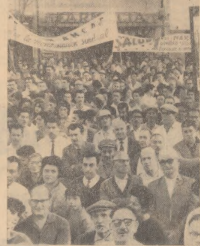
În întreaga lume se desfășoară manifestări de solidaritate cu lupta antirachetă a poporului spaniol. Iată un aspect de la o astfel de manifestare: un miting în sprijinul luptei patrioților spanioli la Montevideo (Uruguay)

Declarația lui Hassel, care este interpretată de toate agențiile de presă occidentale