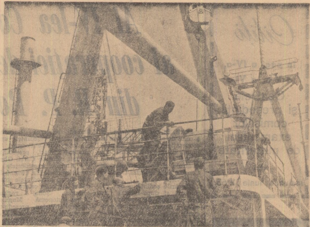
Șantierul naval Galați. Se lucrează intens la unul din corgourile de 4500 tone care a fost lansat de curind la apă.