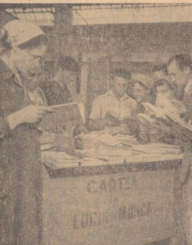
Pentru a veni în ajutorul celor care doresc să-și procure lucrări de specialitate, standul întreprinderii „Electroaparatură” desface în secții, cu prioritate, cărți legate de speciile seriei respective.