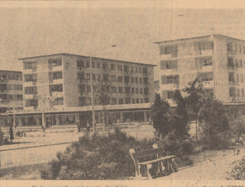
Vedere a noilor construcții din Brăila