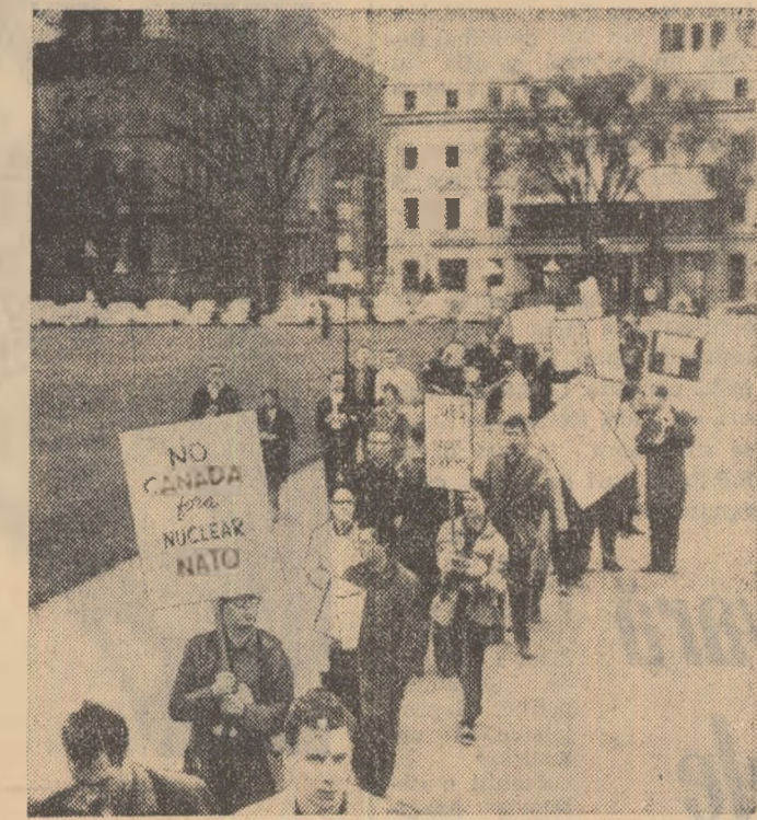
Ottawa: partizani ai păcii canadieni, manifestează în fața clădirii parlamentului. Pe pancarte purtate de ei scrie: „Canada nu are nevoie de arma atomică”. „Ceram muncă și scoli — nu arme atomice”.

BRUXELLES. — În noaptea de 20 iunie a luat sfîrșit sesiunea ministrilor agriculturii ai celor șase țări membre ale Pieței comune. Pe ordinea de zi a sesiunii au figurat încercările de a obține mult discutată „armonizare” în politica agricolă a celor șase țări vest-europene membre ale acestui organ. După cum se știe, această „armonizare” nu a fost pînă acum obținută, în ciuda faptului că programul Pieței comune fixase date calendaristice pentru diferite măsuri în acest sens, date care nu au putut fi respectate. În schimb, între partenerii Pieței comune s-au manifestat divergențe serioase care, după cum sublinia juri seara agenția France Presse, „au provocat o adevărată paralizie” în acest organism în domeniul po-