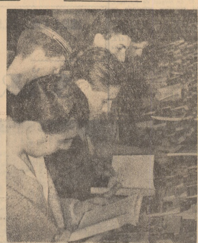
Au sosit cărți noi la Bibliotecă noastră nr. 1 din Brăila

Elevi de la Școala medie de arte plastice din Cluj în schimb de experiență la colegii lor din București