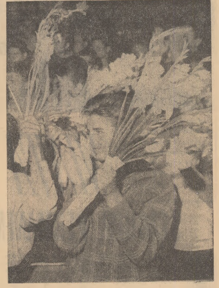
Asemenea florilor e tinerețea. Asemenea florilor vor fi și succesele muncii lor. Și le vor aduna, zi de zi, în buchete tot mai mari.