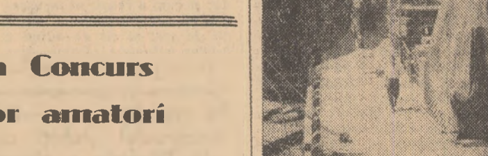
Peisaj industrial (La Șantierul naval Galați)