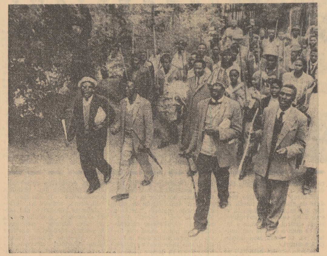
Peste 5000 de muncitori africani din Mbabane (capitala protectoratului britanic Swaziland) au făcut grevă în scopul de a obține majorarea salariilor de mizerie care le sînt plătite de colonialiști. Într-unul din grupurile de demonstrații, în fotografia noastră: aspect de la o asemenea demonstrație.

porunel (cinemascope) Republica (9; 11,15; 13,45; 16,30; 19,00; 21,30); Elena Pavel (9; 11,15; 13,30; 16,00; 18,30; 21; grădina 20,30); Grivița (9,45; 12,15; 14,45; 17,00; 19,30); Alex. Sahla (10; 12,15; 14,30; 17,15; 19,45; grădina 20,15); Patinoarul 23 August (21); 23 August (9; 11,15; 13,30; 16,15; 18,45; 21,30); Lumina de tulle: Magheru (10; 12; 15; 17; 19; 21); Giulești (10; 12; 14; 16; 18,15; 20,30); Lumi-