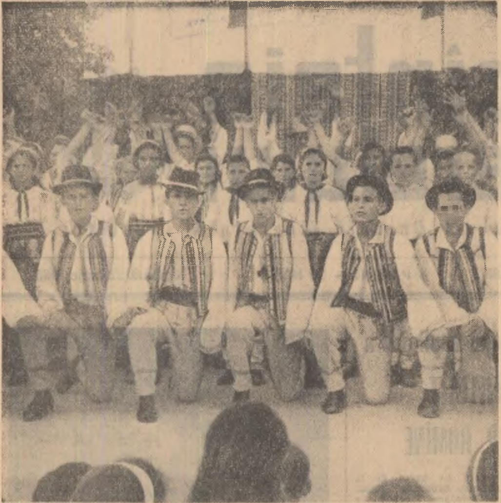
"Hal brigăzi, la întrecere" se intitulează dansul cu temă prezentat la ultima duminică cultural-sportivă de la Tia Mare de artiștii amatori din Dăbuleni, raionul Corabia.