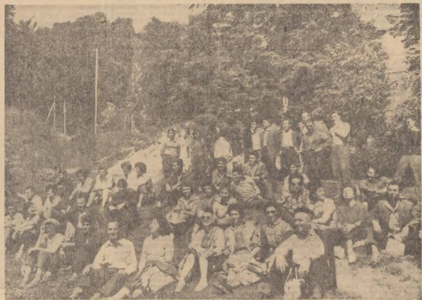
Scurt popas în drum spre Vîrluj cu Dor