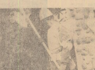
constituie și faptul lajla publicului no-că rezorțul filmului, stru cu un emoțio-Jan Batorzy, a nant film „Viziata trecut examenul în președintelui”.

Demonstrația artistică a faptului că numai munca este singura creatoare de valori este reluată și de rezorțul polonez J. Batorzy într-un film adresat în special copiilor, dar nu numai lor.