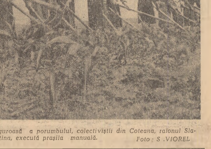
Pentru a asigura creșterea viguroasă a porumbului, colectivitățile din Coteana, raionul Slatina, execută prășia manuală.

Pe mai bine de 300 de hectare ogorul nu a fost lucrat și buruienile au crescut mai mari decit porumbul și îl înăbușă. Plantele sint firave, de o culoare mai mult galbenă decit verde. Firesc era deci ca toate forțele gospodăriei să fie prezente pe timp, la lucru. Dar în ziua aceea nu veniseră la lucru decit ceva mai mult de jumătate din membrii brigăzilor de cimp. La fel s-a întâmplat și în celelalte zile. Faptul acesta duce la întârzierea lucrurilor și, ca urmare, la importante pierderi din recoltă. Nu trebuie uitată experiența proprie din anul trecut cînd porumbului nu i s-a aplicat