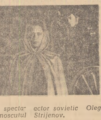
reîntîlnirea spectatrilor cu cunoscutul actor sovietic Oleg Strijenov.

Reluarea unor filme care la vremea lor au cîștigat aprecierea publicului a devenit un obicei. În cadrul acestor reluări vom revizui filmul „Tăunul” — ecranizare a romanului cu același nume al scriitoarei progresiste americane E. Voynich. Filmul va prilejui