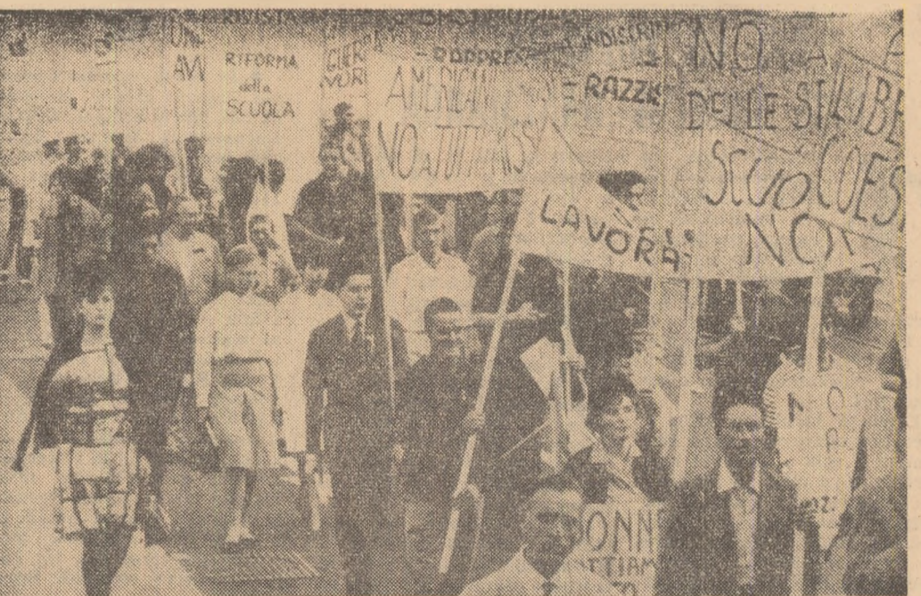
Pe străzile Romei s'a desfășurat recent un marș al păcii, la care au participat numeroși cetățeni. În fotografie: un aspect din timpul marșului păcii.

● GEORGETOWN. — În timp ce primul ministru al Guyanei Britanice, Cheddi Jagan încercă să rezolve diferențele dintre guvern și uni conducători ai mișcărilor sindicale legale de interese coloniale ale Angliei, în țară continuă acțiunile teroriste. Într-o serie de elemente procolonialiste. Potrivit agenției United Press International, „teroriștii au dinamitat o școală elementară distragînd o arăpă a construcției”. Este vorba de școala elementară, din Campbellville, o suburbie a orașului Georgetown unde, din furtive, în momentul exploziei se aflau copii. Totodată continuă demonstrațiile provocatoare. Agenția mai anunță că noi trupe britanice au sosit în Guyana Britanică pentru a „proteja viața și proprietatea”, localnicilor, de fapt pentru a proteja desfășurarea acțiunilor întreprinse de procolonialisti.