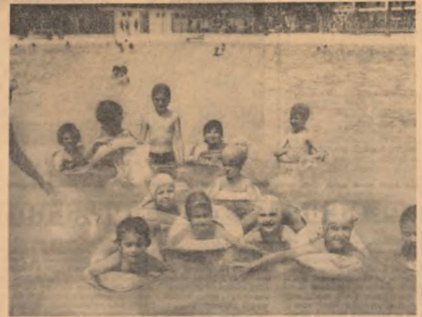
„Care dintre ei va fi campion?”