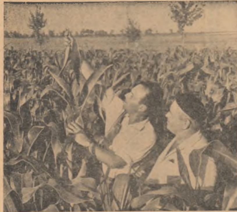
Prăgii ori de câte ori a fost nevoie, porumbul gospodăriei de stat Urziceni, regiunea București, arată acum așa cum îl vedeți în fotografie: des, înalt, bine dezvoltat.