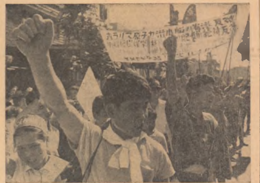
Aspect din timpul unei demonstrații a tineretului japonez împotriva înarmării nucleare, pentru pace.

Nu mai la intervenția poliției grupul de studenți a putut fi împrăștiat, iar manifestele antirasiste confiscate.