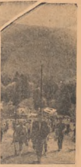
În excursie la „Cota 1400”