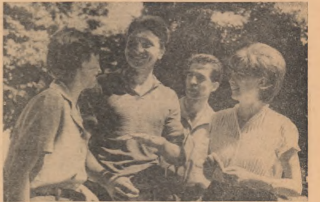
„So vă povestesc cum a fost marea patriotică anul trecut”. Studenții anului I de la Facultatea de istorie contemporană, Foto: I. CUCU