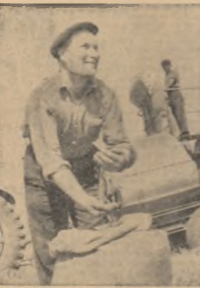
Mecanizatori de la gospodăria colectivă de stat din comuna Mircea Vodă...