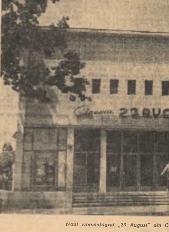
Noul cinematograful „23 August” din Cluj.