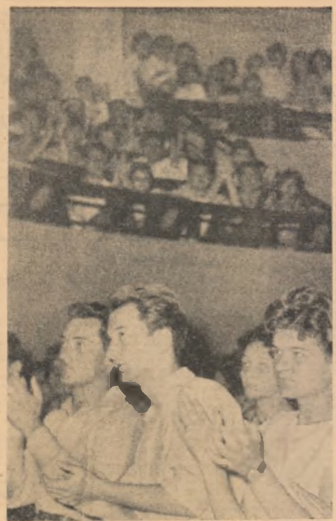
Aspect al adunării de la București