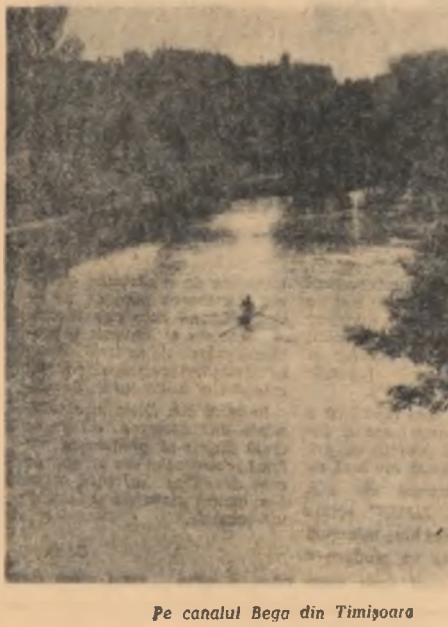
Pe canalul Bega din Timișoara

Cu câteva zile în urmă încă se mai luptă. Se aduceau atacurile gătești cu nișip pentru grupă de sărituri, pentru pista de alergări și se traseau dimensiunile terenurilor pentru diferite probe. Lucrul a luat sfârșit într-o seară. Ultima operație la care au participat tinerii din Bănești, raionul Urziceni, a fost înălțarea firmei: „Baza sportivă a asociației Reședința”. Așadar, să se capituleze: tinerii din Bănești au amenajat o foarte frumoasă bază sportivă, cuprinzând terenuri de fotbal și volei, de handbal, pistă de alergări și grupă de sărituri. Duminică, terenurile au cunoscut intrerile a peste 150 de sportivi, asistați de numeroși colectiviști din comu-