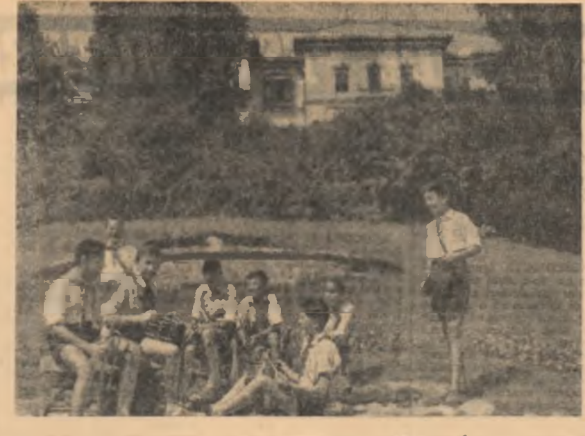
În vacanță!

dențiat în cadrul acestor acțiuni se numără cele de la Uzinele „Vulcan” și Cooperativa „Tehnometal”, de la Școala elementară nr. 146 și G.A.C. Virleju etc. În cadrul festivității, organizațiile U.T.M. care s-au evidențiat în acțiunile de muncă patriotică au primit din partea comitetului raional U.T.M. premii în obiecte: aparate de radio, instrumente muzicale, echipamente pentru sport, aparate de fotografiat etc. Tinerii evidențiați au fost invitați în excursii colective prin țară. În continuare, în cinstea fruntașilor acțiunilor de muncă patriotică, formația de estradă a Statului popular al Capitalei și formația de muzică ușoară a Casei raionale de cultură au susținut un frumos program în cadrul căruia și-au dat concursul și soliiști de muzică populară din Ansamblul S.P.C. Seara s-a încheiat cu dans.