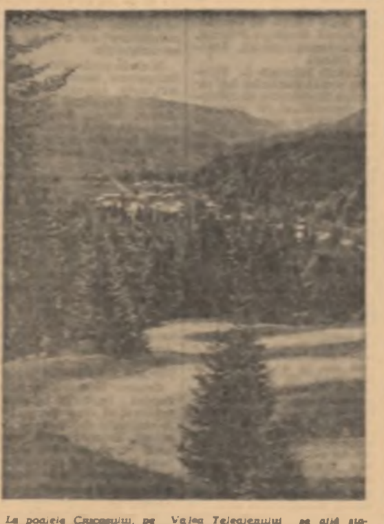
La poartele Cărușului, pe Valea Teleajenului se află stațiunea de odihnă Chisna

din Oradea, str. Etvös nr. 4 precum și Muzeul memorial „ADY ENDRE” — Oradea Muzeul memorial „ARANY JANOS” — Salonta muzele din Beluș, Băile Tîncu și Săcueni