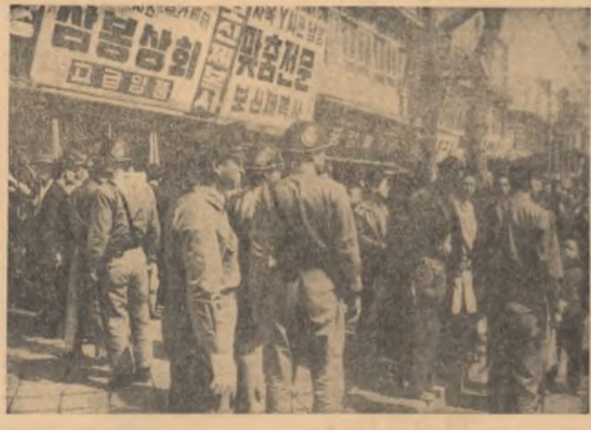
Coreea de sud. Imagine des înfrîntă pe străzile Seoulului: poliția postată pe străzi, este gata să intervină pentru a împrăția o demonstrație antiguvernamentală

se menționează că Bin Akao este acuzat „de organizarea acțiunilor huliganice de la mitingul electoral din parcul Hibya la 12 octombrie 1960, în urma cărora a fost asasinat Asanuma, președintele partidului socialist, de organizarea atacului săvîșit de un grup de elemente de dreapta împotriva delegațiilor la Congresul Partidului socialist democrație din 24 ianuarie 1960 și de dezlănțuirea unei campanii de amenințări împotriva președintelui editurii revistei „Tyo Koron”, dl. Sismanak”.