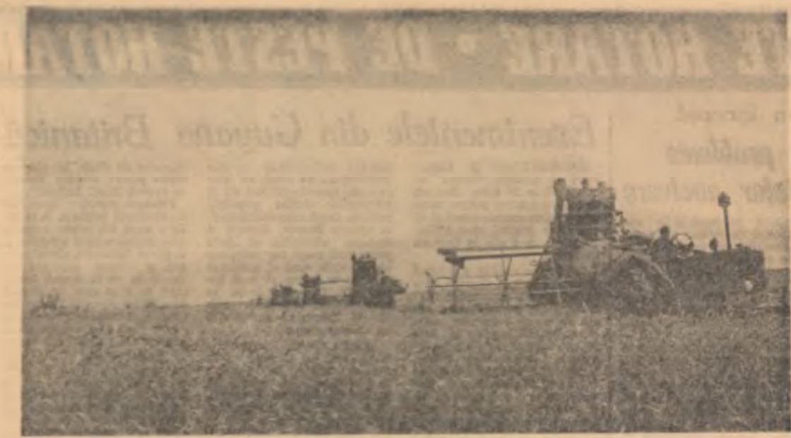
Recoltatul grîului la G.A.C. „Voința” din Corabia

Organizațiile de partid, sindicale, organizațiile de U.T.M. sînt chemate să explice temeinic oamenilor muncii conținutul și urmările pe care măsurile luate le vor avea la asigurarea cantităților de carne necesare acoperirii consumului în continuă creștere, pentru apropierea din ce în ce mai bună a populației de produse alimentare de calitate.