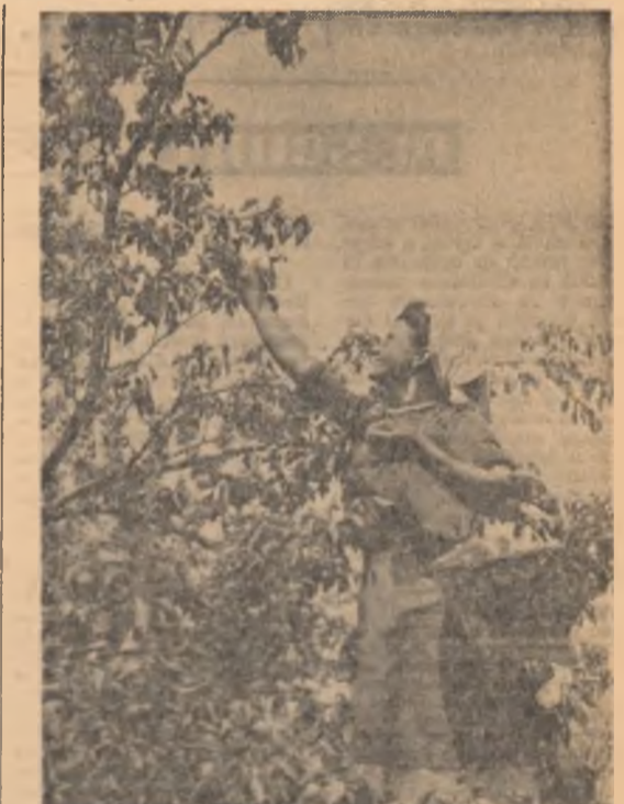
La G.A.S. „Mihail Viteazul”, regiunea București, se culeg cîntecul

Au fost de față membrii Legăției Israelului șefii unor misiuni diplomatice acreditate în R.P.R. și alți membri ai corpului diplomatic.