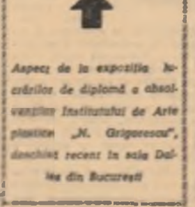
Aspect de la expoziția lucrărilor de diplomă a absolvenților Institutului de Arte plastice „M. Gropescu”, deschis recent în sala Dal-Ne din București

Iar dacă nu vor izbăvi singuri, se vor gîdi mii și mii de oameni, în toată țara, care să-i ajute.