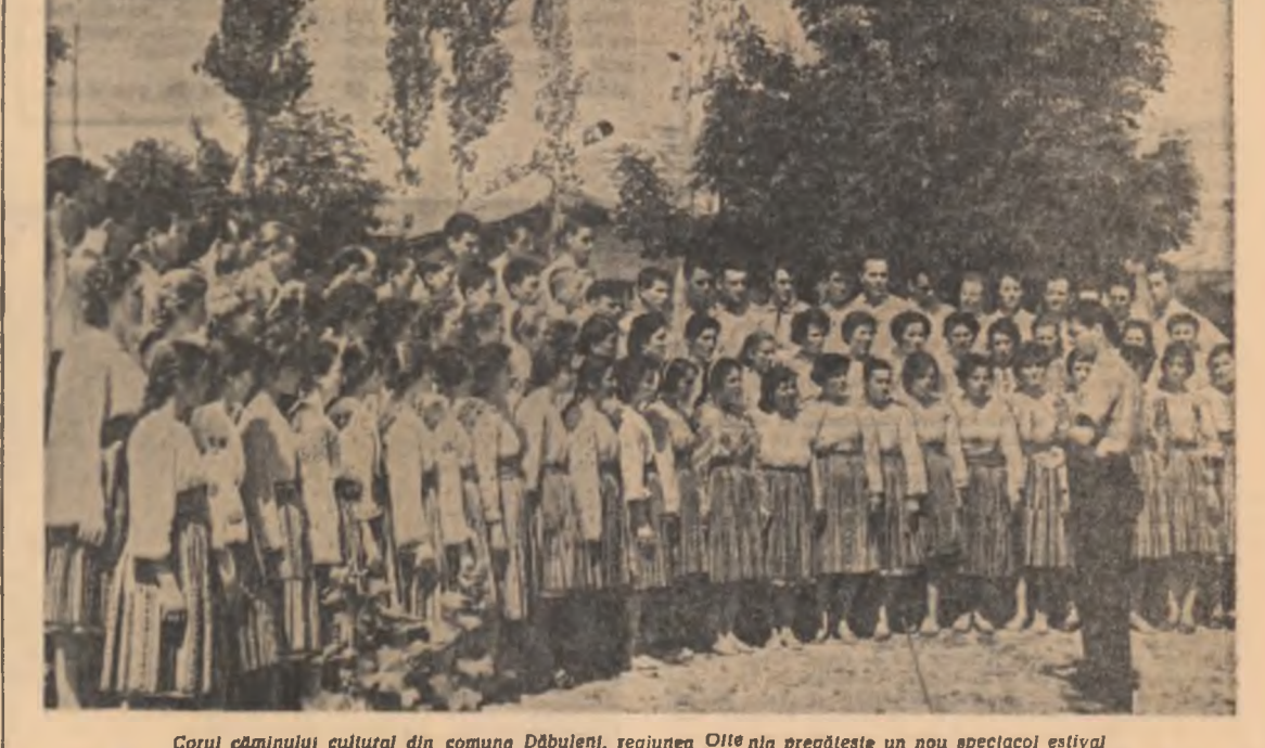
Corul cîminului cultural din comuna Dăbuleni, regiunea Oltenia pregătește un nou spectacol estival

Discul — mai cuprinde un afara concertului nr. 9, una dintre cele mai frumoase dintre Fantazii, scrisă în 1841.