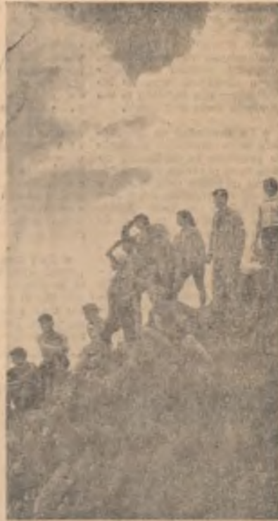
Elevi în excursie la vizita Crîstianului Mare. De aici poate fi admirată o priveliște minunată: Paiana, Brașovul, Predealul...

te specială de diferite culori, dotat cu instala- ții de lumină și sonor- itate moderne, cu scenă în aer liber și cu ecran lat pentru prezentarea filmelor, cu scenă din material plastic (ști- plex), noul Teatru de vară din Mamaia, cu o capacitate de 1.200 de locuri se înscrie în rin- dul celor mai frumoase construcții de pe litoral.