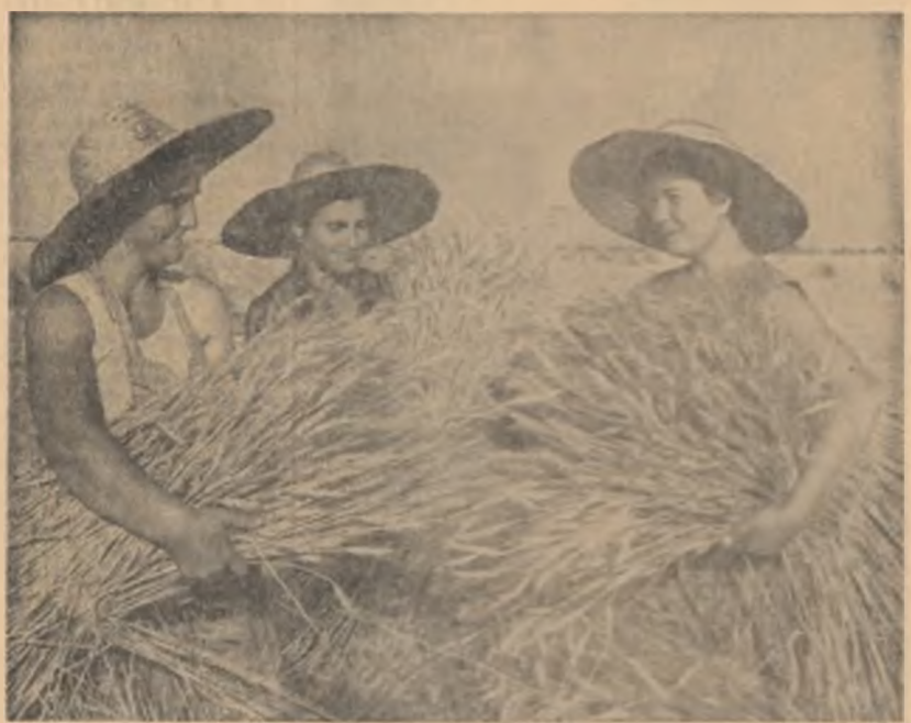
Ultimii anopi de grâu și... marea bucurie a terminării secerișului se împlinește. Imagine din G.A.C. Vărzag, raionul Sînnicolau Mare