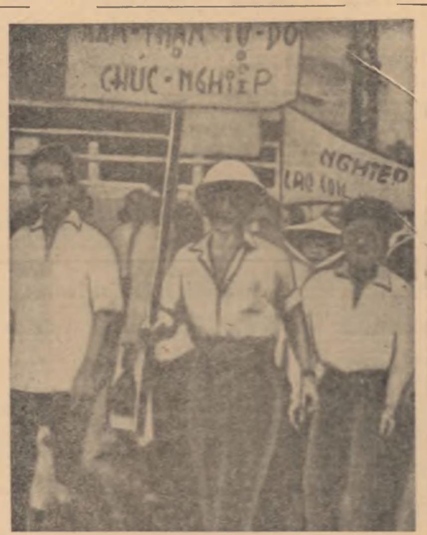
SAIGON: Intrunirea terorei politice, locuitorii ai capitalei sud-vietnameze demonstrează împotriva celor doi dictatori ai lui Ngo Dinh Diem.

ministru Justiției al S.U.A. a subliniat că „nu există o altă problemă mai urgentă astăzi” decît problema rasială. El a cerut crearea unor comisii ale Curții federale pentru grăbirea desființării segregării în școlile din S.U.A. Robert Kennedy a menționat că în 11 state în care populația majoritară este populația de culoare numai o parte infimă dintre negri urmează cursurile școlilor împreună cu albi. Rasiștii se opun cu vehemență chiar și legii limitate propusă de guvern în legătură cu libertatea și drepturile negrilor. Guvernatorul statului Alabama, ultraseparatist George Wallace, luînd cuvîntul în fața unei comisii a Senatului și-a exprimat părerea că datorită atitudinii „de îngăduință” a guvernului față de negri, S.U.A. se află în prezent „în pragul războiului civil” și că „un președinte care a propus o lege ca cea pentru drepturile civile trebuie să fie demis din funcție”.