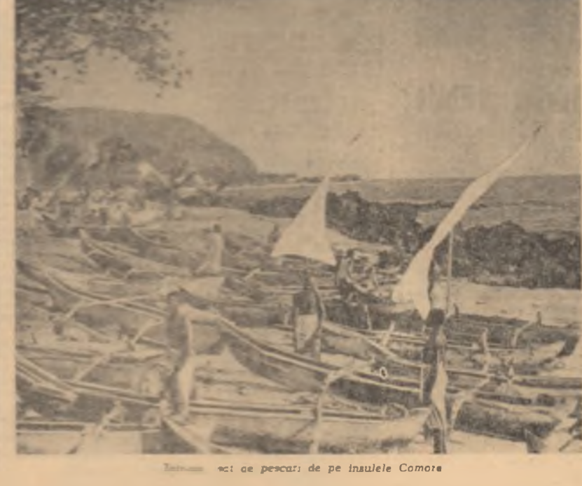
Un grup de pescari de pe insulele Comore

Insulele Comore sînt o arhipelag în partea de sud a continentului African, în Oceanul Indian între Madagascar și Africa. Cele mai importante din ele sînt: Anjouan, Mohéli și Mayote.