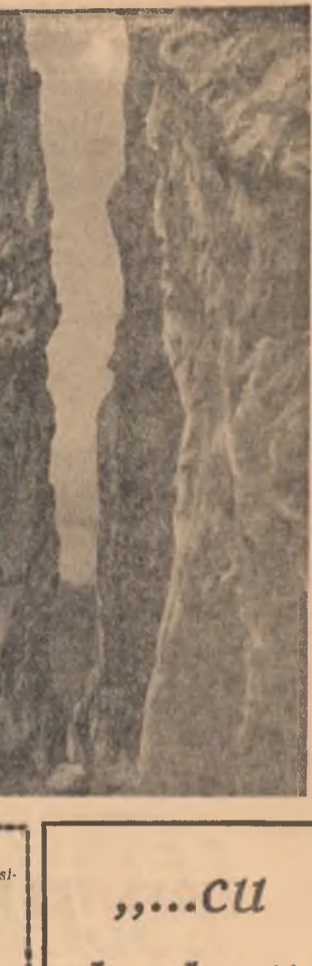
Pietrele Doamnei din Masivul Rarău