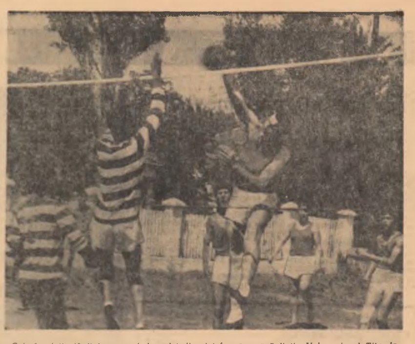
O iad palpitantă dintr-un meci de volei disputat în comuna Bolintin Vale, raionul Titu, în cadrul întrecerilor etapei a doua a Spartachiadei de vară a tineretului