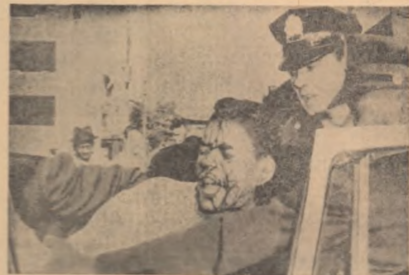
Un grup de studenți din cadrul Institutului Politehnic din Milano

toare au refuzat să lucreze în zilele de sărbătoare. În toate aceste cazuri au avut loc marșuri și demonstrații. În unele orașe au avut loc demonstrații de protest împotriva proiectului de lege guvernamental pe marșurile și grevele organizate în scopul de a împiedica adoptarea proiectului de lege. Chestiunea procedurală a fost însă respinsă de majoritatea guvernamentală.