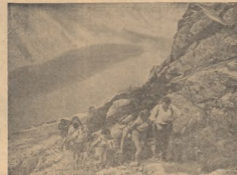
Odată cu zilele vacanței numeroși studenți polonezi au plecat în interesante excursii

„Următoarea întâlnire va avea loc la 18 iulie.”