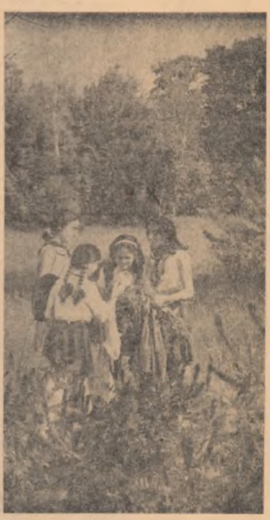
Pionierii din Craiova adunînd în zilele vacanței plante pentru ierbur.

În ziua de 15 iulie s-au descărcat pe rampele marilor combinale siderurgice de la Hunedoara și Reșița încă 2.526 tone fier vechi. Acțiunea patriotică de stringere a fierului vechi mobilizează continuu mii de oameni al muncii din uzine sau șantiere de construcții, colectivități, gospodării și elevi. Din regiunea Brașov pleacă aproape în fiecare zi spre oțelării patriei aproximativ 60 tone de fier vechi. O mare contribuție o aduc colectivele uzinelor „Steagul roșu” și „Rulmentul” din Brașov, „Independența” din Sibiu, Fabrica de articole din tabla Codlea, Mari canășii de metale an strîns anul acesta și oamenii muncii din regiunea Hunedoara, depășindu-și cantitățile prevăzute în prima jumătate a anului cu 11 000 tone, precum și cei din regiunile Banat și Crișana. De la începutul anului și pînă la 11 iulie, oamenii muncii din întreaga țară au expediat oțelării aproape 364 000 tone fier vechi. (Agerpres)