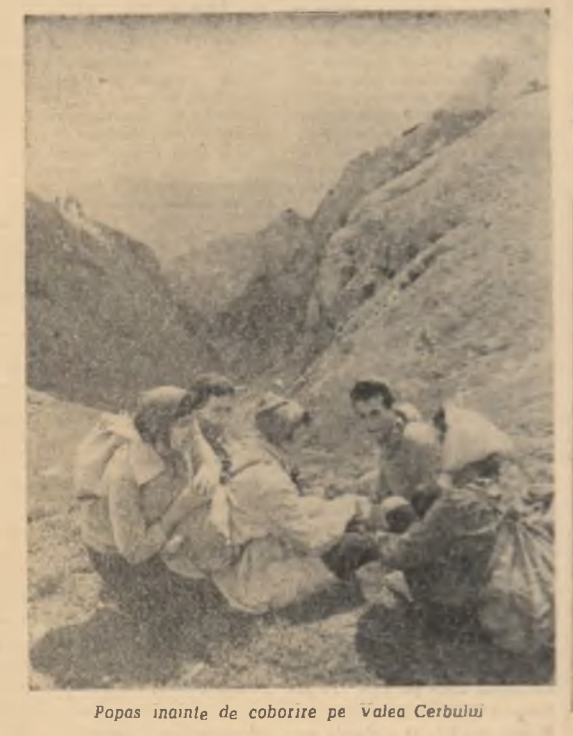
Popas înainte de coborire pe valea Cerbului

Pe terasiile semănate cu porumb și grâu podrișii agrilor la colective „Voința” din comuna Corabia, regiunea Oltenia, plantele au crescut înalte, viguroase și promițătoare bogat, fapt care încheie la care au ajuns inginerul, brigadierii gospodăriei, la urma cooperatorilor din teren. Acesta este rezultatul asigurării unei densități corespunzătoare a plantelor, pe metoda plantat și al lucrărilor de întreținere aplicate în vreme.