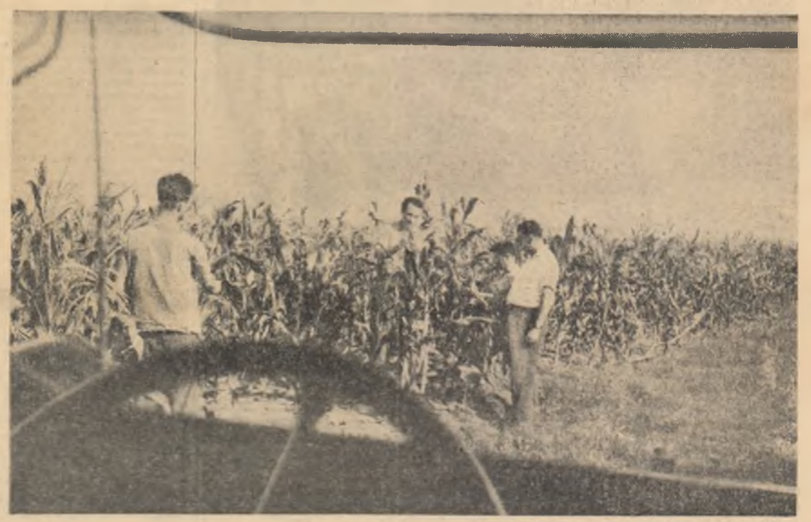
Pe terasiile semănate cu porumb și grâu podrișii agrilor la colective „Voința” din comuna Corabia, regiunea Oltenia, plantele au crescut înalte, viguroase și promițătoare bogat, fapt care încheie la care au ajuns inginerul, brigadierii gospodăriei, la urma cooperatorilor din teren. Acesta este rezultatul asigurării unei densități corespunzătoare a plantelor, pe metoda plantat și al lucrărilor de întreținere aplicate în vreme.