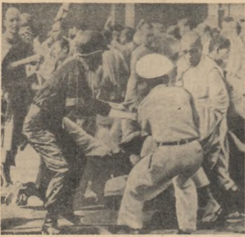
SAIGON: Poliția atacă cu brutalitate un grup de budisti care demonstau împotriva presiunilor cliiei dictatoriale a lui Ngo Dinh Diem.

tugaliilor”. În care autoritățile au dreptul să reprime cu toată cruzimea pe luptătorii pentru independență. Autoritățile lui Salazar au șters cuvîntul independență din vocabularul lor și vorbesc despre „misiunea istorică” a Portugaliei. Autorul articolului nu își ascunde încă scepticismul față de posibilitățile Portugaliei de a-și mai menține multă vreme dominația colonialistă asupra Guineei.