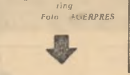
Culegători de alune în Paring.