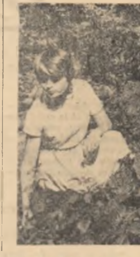
forturi mai mari. Casa pionierilor din Constanța a luat inițiativa de a pregăti dinainte fiecare serie de elevi pentru programul din tabără. Drumețiile de o zi în împrejurimile Constanței, învățarea de cîntece și jocuri, descrierea traseelor pentru excursii încă înainte de a se porni spre tabără, toate contribuie acum

În localul școlii medii din Predeal se află o tabără organizată de Casa pionierilor din Constanța. Aici își petrec