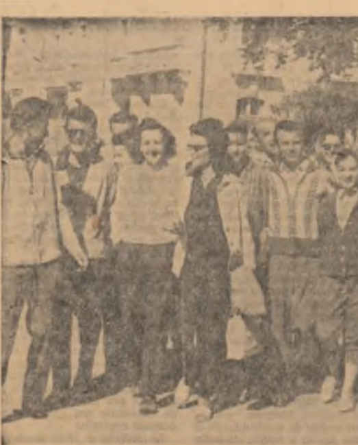
Oamenii muncii sosii la odihnă în Sinaia, plecînd într-o excursie