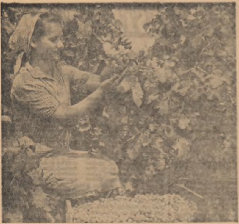
La G.A.C. „Ogozul nou” din comuna Greaca, raionul Olenița, regiunea București, a început recoltarea strugurilor de masă. De aici zilnic se recoltează peste 10.000 kg struguri.