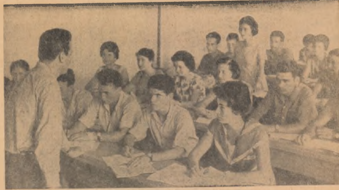
Au început cursurile de pregătire a propagandistilor de la învățămîntul politic U.T.M. Vă prezentăm un aspect de la cursul de 10 zile organizat de Comitetul regional U.T.M.-București