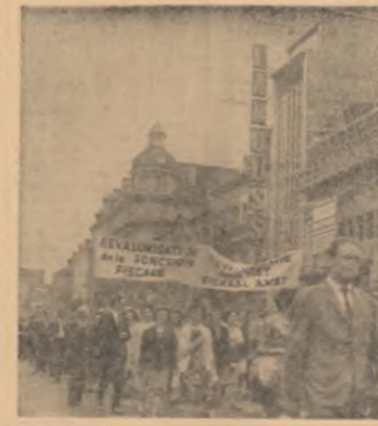
Funcționarii belgieni din Bruxelles, Anvers și alte orașe belgiene continuă greva la sprijinul salariaților lor. În fotografie: Demonstrația de stradă de la Bruxelles la care au participat peste 2.000 de greviști.

Laburistul Driberg i-a cerut lui Macmillan să precizeze ce