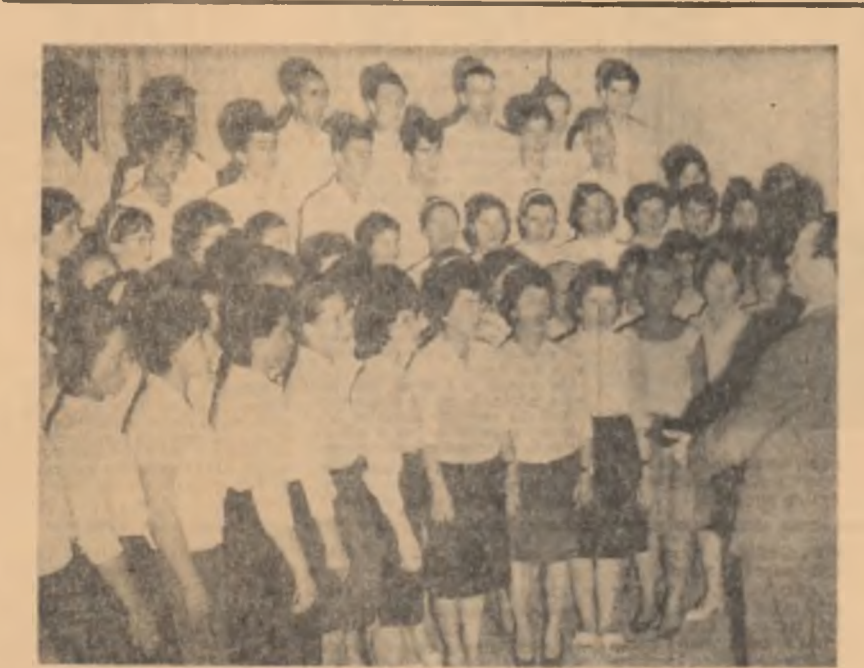
Corul Casei de cultură din Brănești, regiunea București

Institutul Politehnic București, calea Griviței nr. 132, raion 30 Decembrie, telefon 13.54.40 sau 16.40.80, anunță începerea cursurilor de pregătire — seria a II-a de la 5 august — 1 septembrie 1963. La aceste cursuri pot participa totuși absolvenții școlii medii sau școlii echivalente. Pentru înscriere, candidații vor prezenta dovada de absolvire a școlii medii sau școlii echivalente și buletinul de identitate. Înscrierile se fac în localul Institutului Politehnic București, la centrul de îndrumare din str. Polizu nr. 5, pînă la data de 4 august inclusiv. Orele de funcționare a centrului sînt 9—14. Institutul Politehnic București asigură cazare și masă contra cost, în limita locurilor disponibile.