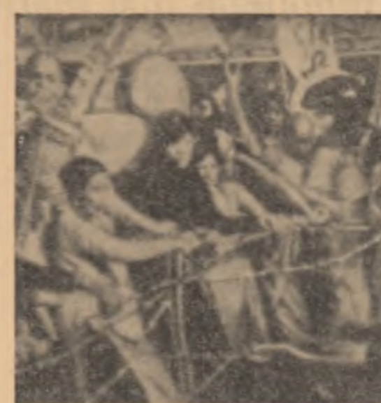
Autoritățile deosebite au baricadat străzile cu sîrmă ghimpată pentru a opri demonstrațiile buzdînilor care se opun guvernului sud-vietnamez. În fotografie: Demonstrații buzdînilor armînd cu miinile goale sîrmă ghimpată în cîmpul poliștilor care stau de strajă.

Reproducem mai jos fragmente din notele de călătorie ale ziaristului sovietic M. Domogașki care a vizitat recent Kenya. Aceste note au fost publicate în revista sovietică „Nedelea”.