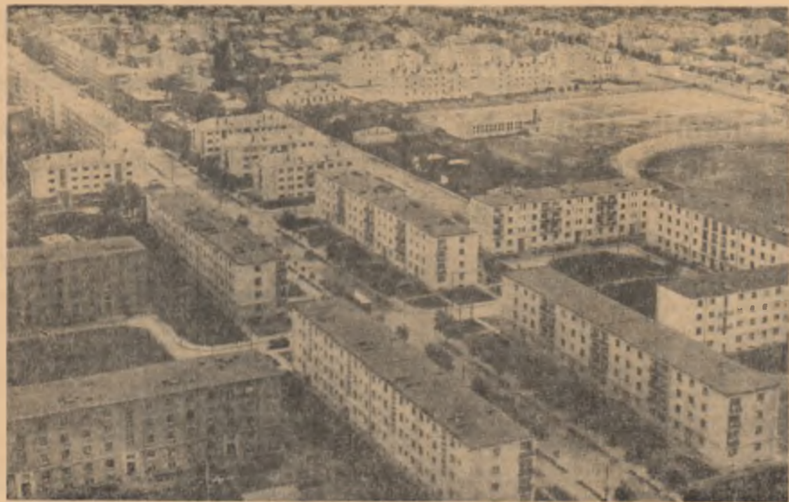
Vedere din orașul Roman

Succese de seamă au obținut și furnaliștii. Măsurile tehnice aplicate pentru ridicarea temperaturii aerului insuflat în furnale, asigurarea unei bune funcționări a instalațiilor termice au permis furnaliștilor reșițeni să elaboreze peste prevederile planului lunar 3.600 tone fontă. (Agerpres)