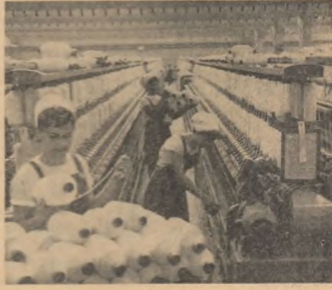
Aspect de muncă din zona halei de rinouri de la Filatura Românească de Băicoș din Capitală

Gospodăriile colective din regiunea Crișana sînt ajutate îndeaproape de consiliile agricole în îmbunătățirea vaselor de animale și în ridicarea productivității acestora. În acest an, numărul centrelor de înămînțări artificiale de lactație, față de anul trecut, în aceste gospodării, producția pe cap de vacă furajată a crescut cu 200-350 litri. Toate aceste măsuri au dus la creșterea numărului de animale cu producții mari și la îmbunătățirea vaselor. În prezent, mai mult de 70 la sută din numărul vacilor și junicilor existente în gospodării sînt din rase de mare productivitate. În raioanele de șes mai mult de 90 la sută din numărul oilor sînt de rasă merinos. (Agerpres)