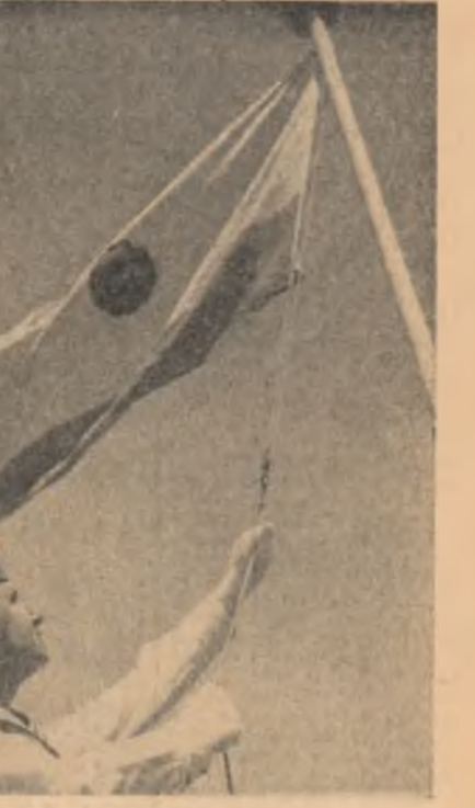
Moment solemn — ridicarea pavilionului pe navă