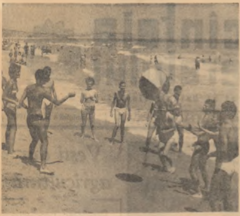
La tabara de odihna a studenților de la Costinești