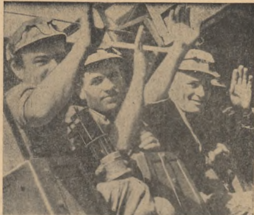
Noroc bun!

Se vor ridica în anul regimului de democrație populară, în locul cocloanelor, blocuri zvelte, elegante în toate localitățile minierești. Pînă în prezent, construcțiile au pus la dispoziția minerilor Văii Jiului un număr de 8.000 de apartamente de locuit, 12 blocuri-cămin pentru tinerii mineri necăsătoriți, au fost ridicate 1.200 de case particulare, numai în centrele miniere.