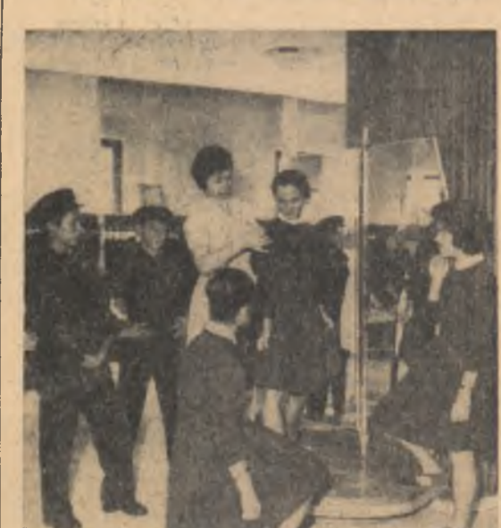
La Magazinul copiilor din Capitală a început vînzarea unilor melor școlare