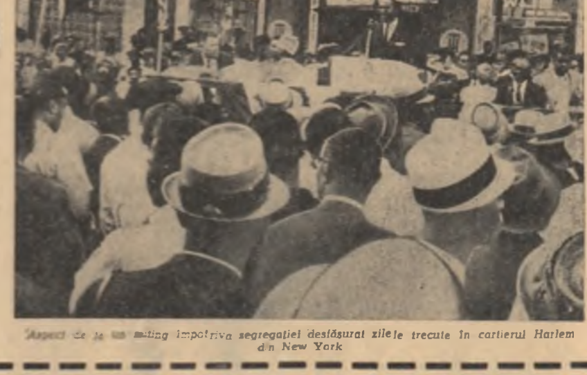
Aspect de la un meeting împotriva segregării deslășurat zilele trecute în cartierul Harlem din New York

într-o conferință de presă, în care a prezentat ministrul de Finanțe al Angliei, Maudling, reprezentanții sindacatelor engleze l-au întrebat pe acesta dacă există un plan de conducere a serviciilor tineretului și șomajului. Maudling va scrie că de-a lungul timpului, există în termenii generali că s-au luat măsuri și se vor face noi pași în vederea „atenuării economice”. Se știe că guvernarea recentă ale economiei engleze, în special mizergia, încreștarea și incapacitatea de producție, fapt care duce la o îngustare a posibilităților lor de mișcare a șomajului.