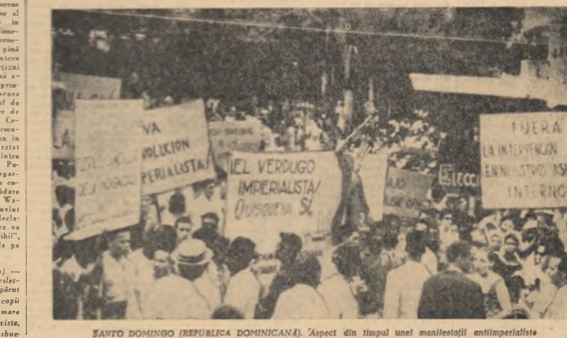
SANTO DOMINGO (REPUBLICA DOMINICANĂ). Aspect din timpul unei manifestații antiimperialiste

În cuvîntul său de răspuns, Manolis Glezos a subliniat: printre altele: „Calea pe care trebuie s-o mai străbată omenirea în lupta pentru întărirea păcii este încă lungă. Piedicile și greutatea care trebuie să fie înlăturate sînt încă mari. Cu toate acestea noi primim cu optimism spre viitor”. „Pe zi ce trece, a subliniat Manolis Glezos, devine tot mai clar că lupta popoarelor imbinată cu politica de pace a țărilor socialiste și a celorlalte țări care sînt pentru coexistența pacifică, constituie un factor decisiv în preîntîmpnarea unui război”.