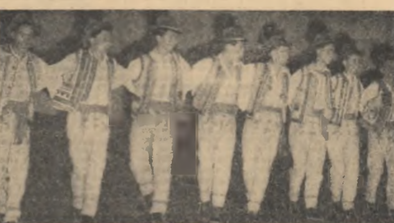
Ansambllul folcloric „Așanul” din regiunea Oltenia, a prezentat la „Arenele Libertății” și la Teatrul de răză „Nicolae Bălcescu” din Capitală, spectacolul „Drağă mi-i Oltenia”, alcătuit cu concursul celor mai bune formații ale artiștilor amatori din satele și orașele regiunii. În fotografie: aspect de la unul din spectacole.