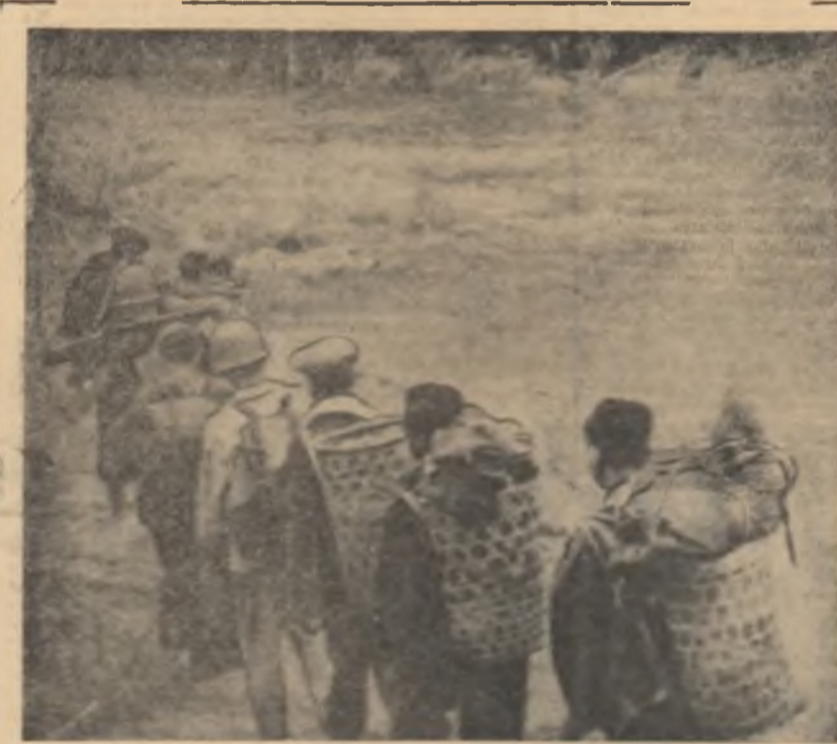
Purtătorii cuvîntului în mare, pregătind un altor împotriva trupelor de pace