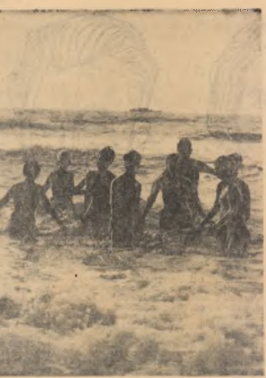
În labăra de la Costinești