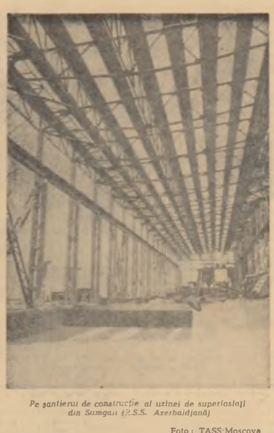
Pe șantierea de construcție al uzinei de superfosfați din Samgari (R.S.S. Azerbaidjan)