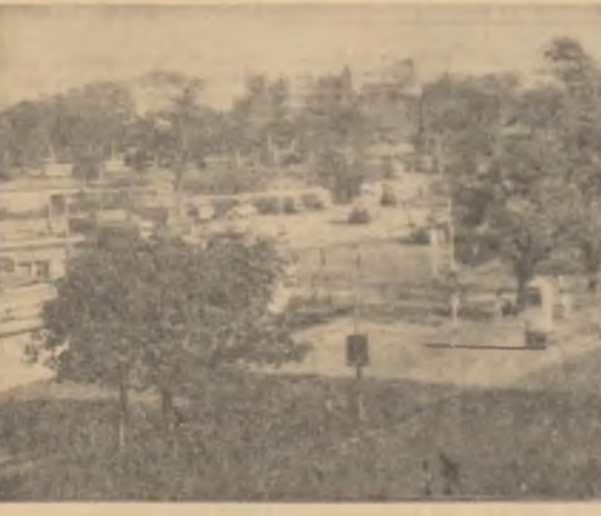
Astăzi, poporul Indiei sărbătorește o dată importantă din istoria sa — 16 ani de la proclamarea independenței. 16 ani de cînd, datorită oștinții mișcării de eliberare, guvernul englez a fost nevoit să acorde Indiei independența.

Președintele a subliniat importanța pe care o are pentru cauza păcii Tratatul de la Moscova cu privire la interzicerea experiențelor cu arma nucleară în atmosferă, în spațiul cosmic și sub apă.