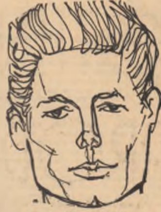
ISTRATE STELIAN G.A.S. „Baruch Berea” — raionul Făurei