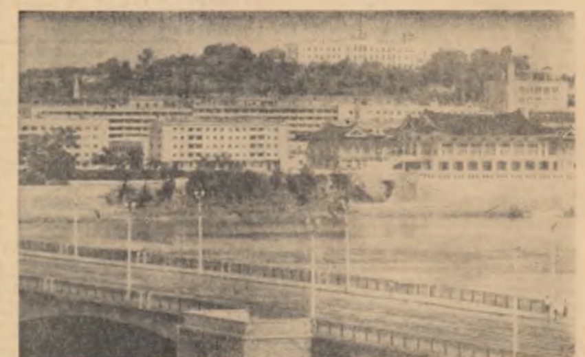
Vedere din Phenian — capitala R.P.D. Coreene

Cu prilejul marilor sărbători a R.P.D. Coreene, poporul și tineretul din R. P. Romîni urează poporului și tineretului coreean să dobîndească noi succese în opera de construire a socialismului, în lupta pentru unificarea pasnică a țării, pe bază democratică, pentru apărarea păcii.