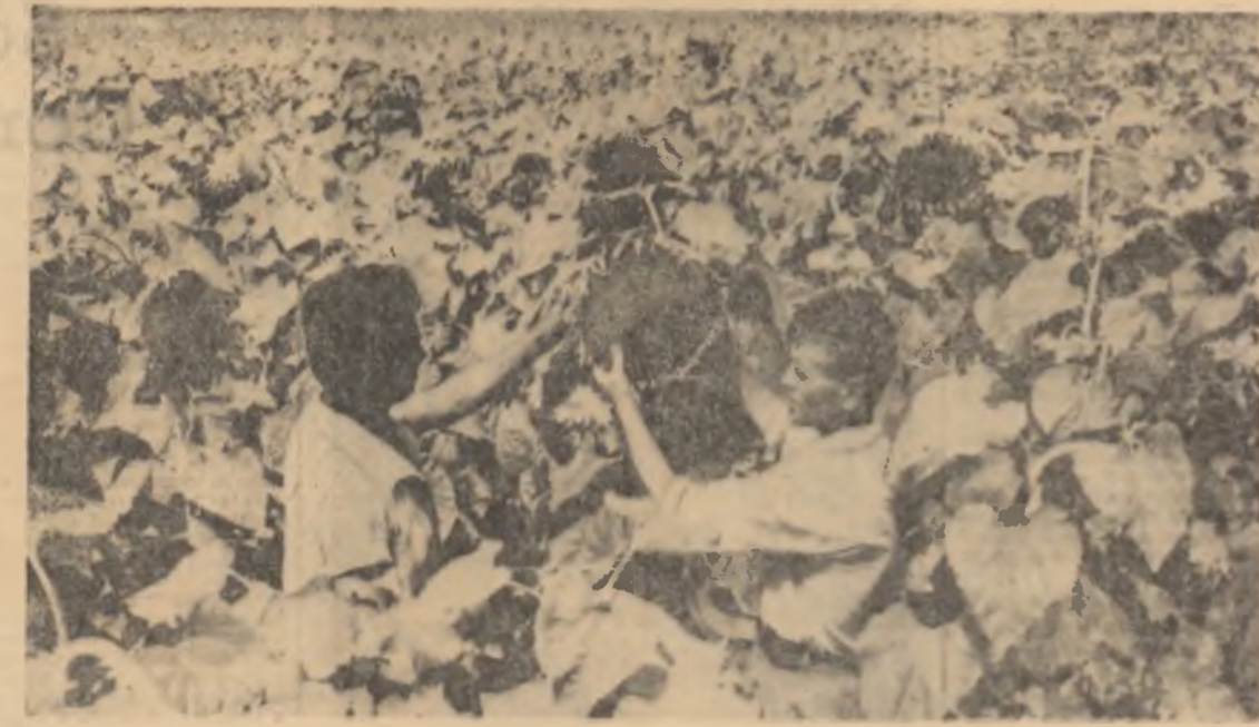
La G.A.C. „30 Decembrie” din comuna Crevedia, raionul Râcnari studiul de lucrare al florilor soarelui este avansat. În zilele imediat următoare, va începe recoltatul.