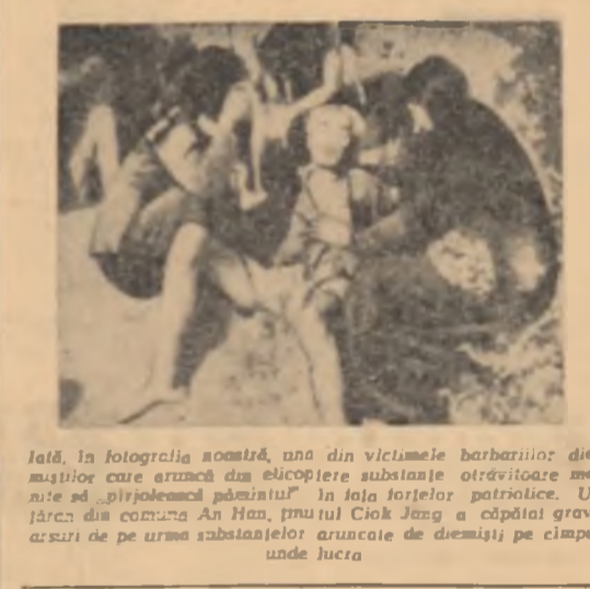
La 16, în fotografia noastră, una din victimele barbarilor democrației care aruncă din elicoptere substanțe otrăvitoare menite să „divulgate pășinul” în fața forțelor patriotice. Unele jăre din comuna An Han, în provincia Ciok Jeng a căpătui grave arsuri de pe urma substanțelor aruncate de demisiți pe timpul unde lura

Noul guvern congolez a dat publicității o declarație cu privire la principalele măsuri luate pe plan intern și extern. Printre acestea figurează acordarea unei amnistii generale tuturor deținuților politici, restabilirea libertăților civile, dizolvarea adunării naționale. Pe plan extern, menționează agenția France Presse, se pare că noul guvern congolez intenționează să prevină o politică puțin diferită de aceea a guvernului precedent. Potrivit declarației guvernului „va respecta acordurile internaționale semnate de guvernul precedent, garantează securitatea persoanelor și a bunurilor străine aflate în Congo și își reafirmă prietenia față de Franța”. Totodată, guvernul provizoriu a declarat că își menține apartenența la diferitele organizații africane ca Organizația unităților africane, Uniunea afro-malgășă etc.