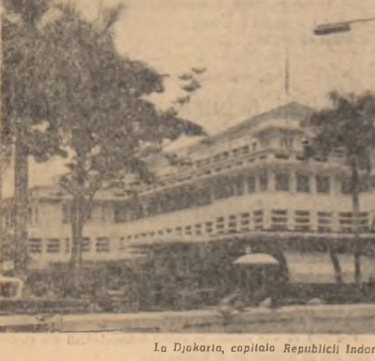
La Djakarta, capitala Republicii Indonezia