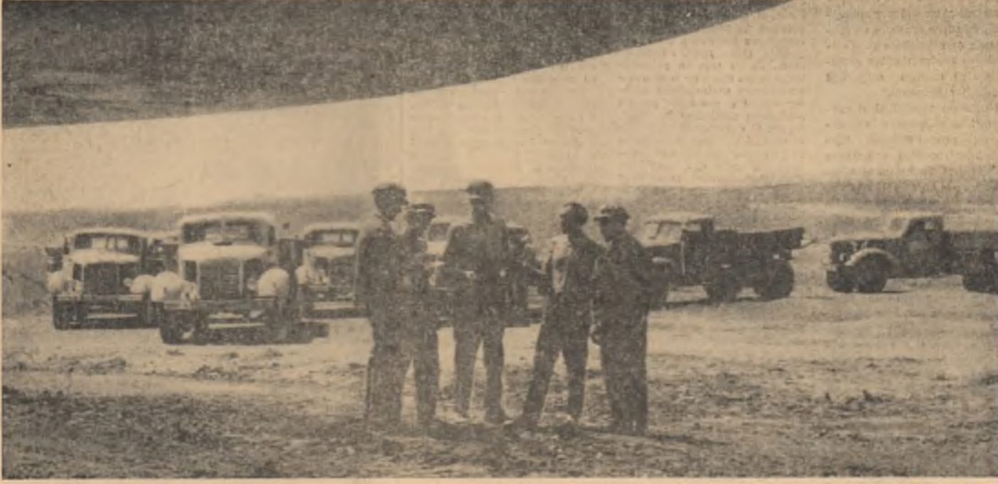
Asigurarea unui ritm rapid de descoperire constituie un obiectiv principal al întrecerii socialiste la exploatarea minieră Rovinari. Aici se descoperă zilnic peste 24 000 m.c. stierli. Între brigăzile care obțin cele mai bune rezultate în sectorul transportului se numără și cele conduse de tinerii golari. În fotografie: cîțiva dintre ei discută programul de lucru al unei noi zile de muncă.

Cititi In pag. a II-a: Pentru sporirea continuă a producției agricole Lucrările ședinței Consiliului Superior al Agriculturii