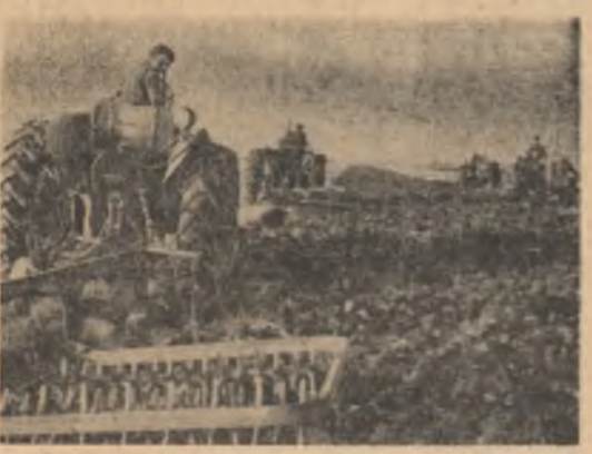
Tinerii mecanizatori din brigada a 10-a de la S.M.T. Horia trag brazde adînci pe ultimele din cele 600 de hectare de mîrișe ale G.A.C. Ileana, regiunea București

DEVA (de la corespondentul nostru). — Continuînd cu înfocșirea întrecerii socialiste pentru îndeplinirea și depășirea sarcinilor de producție, laminorii de la secția 800 mm, precum și cei de la liniile de profile fine și sîrmă din Combinatul Siderurgic Hunedoara obțin în aceste zile succese deosebite pe care le închină celei de-a 18-a aniversări a eliberării patriei noastre dragi. Urmărind în permanență exploatarea rațională și întreținerea în bune condiții tehnice a agregatelor pentru evitarea pe această cale a staționării neplanificate pentru reparații, laminorii din secția amintită au reușit să sporească viteza de laminare și să înregistreze astfel indici ridicați la productivitatea muncii. Productivitatea muncii a crescut față de sarcina planificată cu 2,41 la sută la laminorul de 800 mm, cu 7,71 la sută la linia de sîrmă și cu 16,15 la sută la linia de profile fine, fapt care a determinat depășirea continuă și ritmică a planului de producție. Numai pe primele 15 zile ale acestei luni, colectivele respective au laminat în plus 930 de tone de oțel, iar de la începutul anului și pînă în prezent el au dat patriei mai bine de 17.000 de tone laminate de diferite profile peste plan.