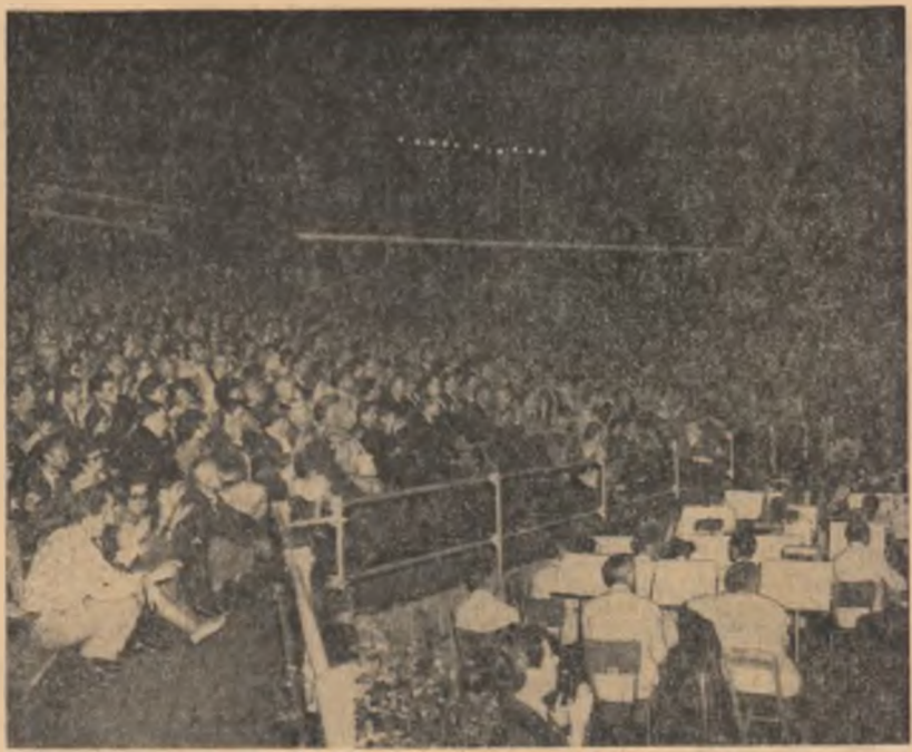
Un mare număr de spectatori au aplaudat, la Torino, evoluția artiștilor români