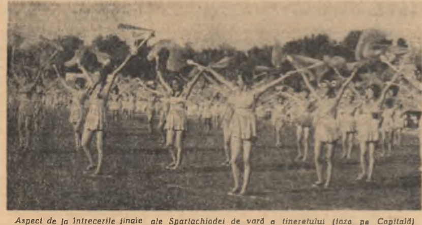
Aspect de la întrecerile finale ale Spartachiadei de vară a tineretului (lăza pe Capitală)