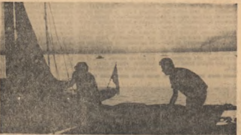
Se ridică pinzele