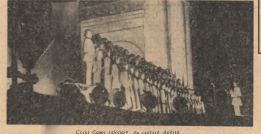
Corul Casei raionale de cultură Agnita