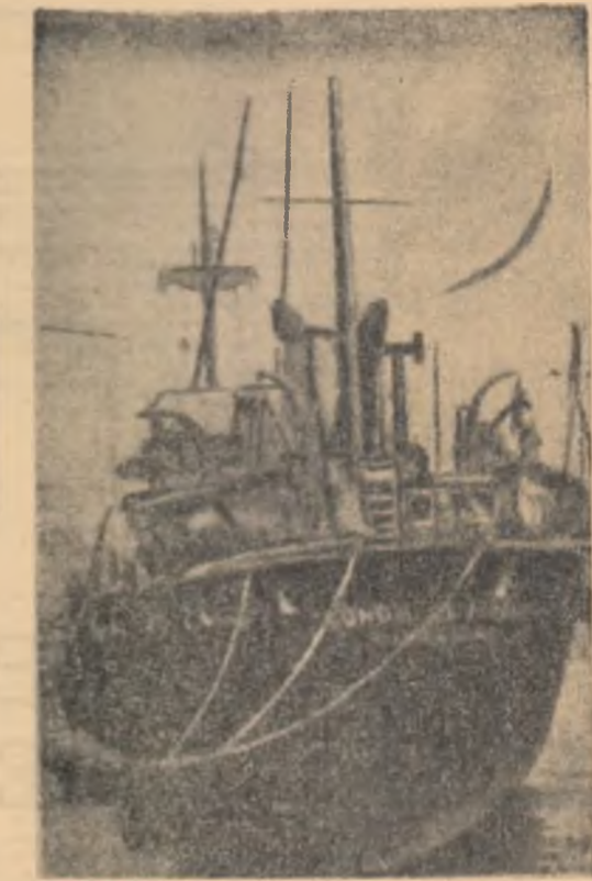
În semn de protest împotriva regimului franchist, în numeroase porturi muncitorii refuză descărcarea navelor spaniole. În fotografie: nava spaniolă „Conde de Figols”, supusă boicotului în portul italian Genova.

WASHINGTON — Casa Alba a dat publicității textul unei scrisori adresate președintelui Kennedy de către cuibocul om de știință Albert Schweitzer, laureat al Premiului Nobel, una din personalitățile marcante din cadrul mișcării internaționale pentru dezarmare și înlăturarea primei etape în înlăturarea se subliniază importanța Tratatului de la Moscova cu privire la interzicerea experiențelor nucleare, în atmosferă, în spațiul cosmic și sub apă ca un prim pas spre rezolvarea problemei dezarmării. „Tratatul dintre est și vest cu privire la renunțarea la experiențele nucleare, în atmosferă, în spațiul cosmic și sub apă — se spune în scrisoare — ne dă speranța că războiul cu arme atomice între est și vest poate fi evitat”. Semnatul scrisorilor subliniază că prin acest tratat „lumea a înfăptuit un prim pas pe calea spre pace”.