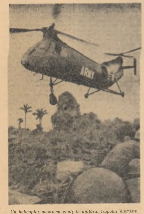
Un helicopter american veni în ajutorul trupelor diemiste