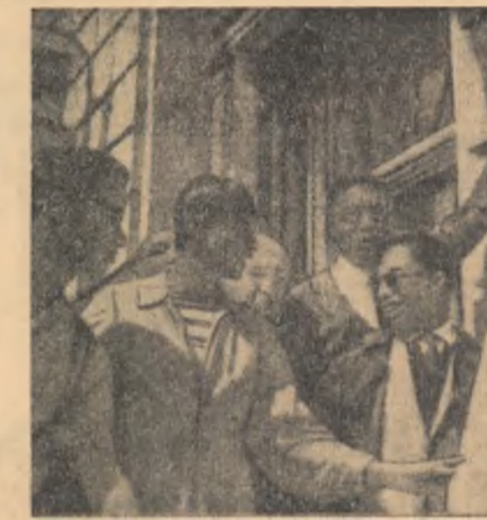
Un grup de studenți sud-vietnamezi din Paris i-a chemat guvernul din Franța să deschidă o grădă de studenți sud-vietnamezi pentru rezolvarea conflictului religios.

în continuare, va însemna o expresie a protestului împotriva violenței rasiale. El va fi simbolul luptei oamenilor de culoare pentru a obține drepturi cetățenești depline. Negrii doresc aceleași drepturi ca și albi, fără nici un fel de rezerve, adică egalitate deplină — socială, economică și politică. Reprezentanții ai organizațiilor „Marșului” au declarat că vor insista să fie primii atit de membri ai Congresului S.U.A., cit și de președintele Kennedy pentru a le cere respectarea drepturilor populației de culoare. După cum transmit agențiile occidentale de presă, deși organizatorii au anunțat că „Marșul” se va desfășura pașnic, poliția din Washington a fost mobilizată în întregime și a primit drept întărire 4.000 de soldați.