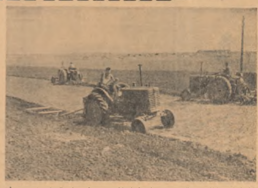
In campania arăturilor de vară se trag ultimele brazde pe terenurile gospodăriei agricole de stat Moșneni, regiunea Dobrogea.

In anul acesta, sectorul zootehnic al gospodăriilor agricole colective din regiunea Cluj a crescut simțitor ca urmare a reținerii animalelor de mare productivitate din matcă proprie. În prezent, paralel cu muncile agricole de sezon, colectivitățile din această parte a țării lucrează intens la ridicarea construcțiilor zootehnice pentru adăpostirea animalelor în timpul iernii. Pînă acum, aproape 500 de grajduri, maternități, îngrășători pentru porci, cotețe etc. din cele planificate pentru anul acesta sînt fost terminate, alte peste 400 de obiective sînt într-un stadiu avansat. Pentru a reduce costul noilor construcții, colectivitățile din raionul Dej au folosit pînă acum peste 5 milioane de cărămizi confecționate de ei, aproape 23.000 mc de piatră și balast extra-se din cele mai apropiate cariere, însemnate cantități de lemn etc., reducînd prețul de cost al construcțiilor cu peste 20 la sută față de deviz.