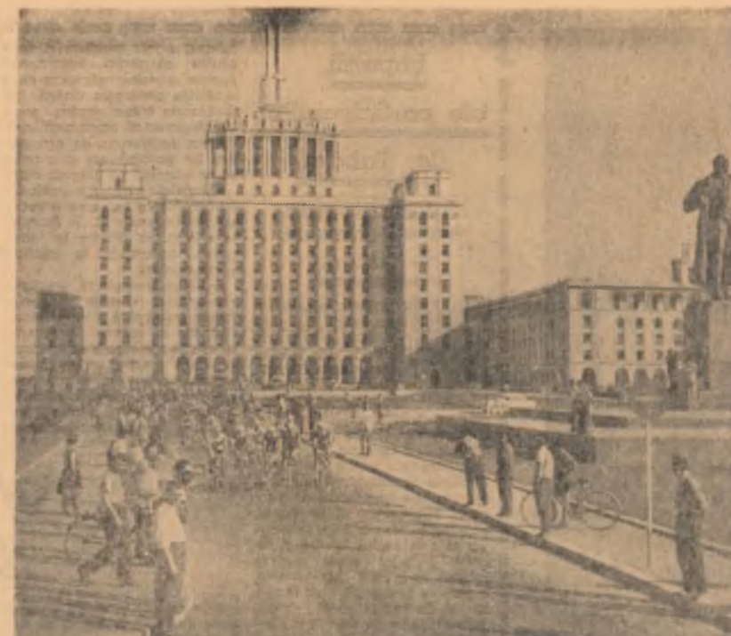
Aspect de la plecarea la „Cursa Scînteii”