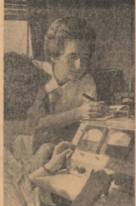
1500 tone cocs peste plan. Intra unul din laboratoarele Institutului de Fizică al Academiei R.P.R. două tinere cercetătoare studiază proprietățile semiconductoare ale straturilor de germaniu — straturilor și amoniu de cristaline și germaniu.