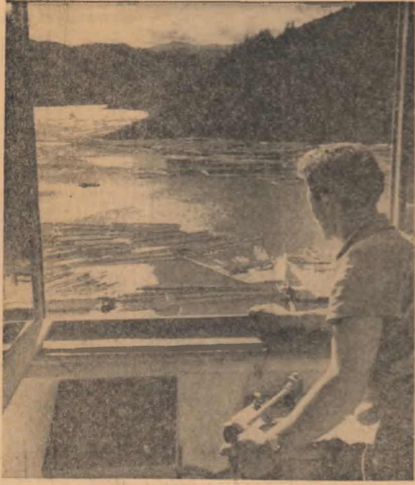
Pe locul de acumulare de la Blecă a fost dată în exploatare o stație automată de încălzit bușteni. Colectivul de muncă al stației încarcă zilnic în medie 1.800 mc de bușteni rășinoase.