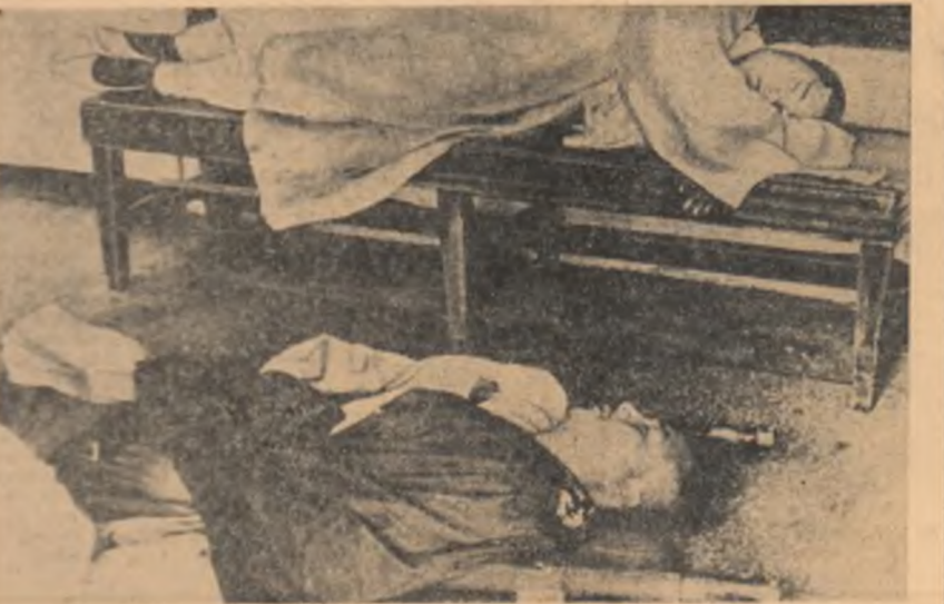
Budizii din Seul, capitala Coreei de sud, protestează împotriva persecuțiilor la care sînt supuși. O recentă demonstrație budistă a fost atacată de poliție, numeroși demonstrații fiind răniți. În lola: doi dintre demonstrații budizii răniți.

Cu urmare a votului de astăzi din Comisia pentru afacerile externe a adăugat și consider că în Senat numărul celor ce vor vota împotriva va fi mic. Potrivit agenției U.P.I., raportul Comisiei va fi prezentat Senatului S.U.A. la 4 sau 5 septembrie, urmînd ca dezbaterile în Senat să înceapă la 9 septembrie.