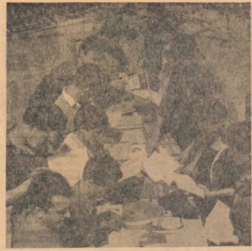
Unde poate fi realizată o asemenea imagine fotografică? Pretulindem în țara noastră, lîngă pretulindem tineretului cîntec, studiază insistentul de laudă și doar un argument al acestei pasiuni umanitate despre care tinerii din sectorul scolare al „Întreprinderii 7 Noiembrie” din Craiova ar putea spune multe.

prinde un mare număr de poezii de proză, indesebîi reportajul bucurîndu-se de o mai largă prezentă. Insemnările, aduc nota curioasă de prosopetivă, mărturisind din partea autorilor o preocupare lăudabilă pentru descoperirea relațiilor noi care se stabilesc între oameni, pentru schimbarea rapidă a peisajului rural („Sistemul de Ilie Tîndăscu” de Ilie Tîndăscu, „La izvorul cîntecelor” de Manola Brădeș, „Floarea Baicu și torarșii săi” de N. Valea — toate în „Pagini din urmă”, „Portretele” lui Ion Istrati în „Laudă patriei”). În unele însă, se manifestă o nedorită manieră descriptivă, o trăsere grabită și înregistrare egală a unui tînder arăbătit, fără acele nuanțări sugestive care fixează, dîndu-le relief plastic un anumit aspect ori fenomen foarte semnificativ. Desigur, tot ce vezi este interesant și nu condeii abilități agrementează descrierea, dar un reportaj constituit dintr-o succedă de doapuri decora monoton la lectură. Se impune, de aceea, o diferențiere a modalităților, așezînd pînd la numărînd stilistic. Chiar va reporter talentat cum este Ilie Tîndăscu se mulțumește cu o descriere lipsită de nerv, nepersonală („Amintiri dintr-o toamnă”). De altfel, diferențierea aceasta — rezultat al unei selecții riguroase — se impune și în cazul plachetelor de versuri.