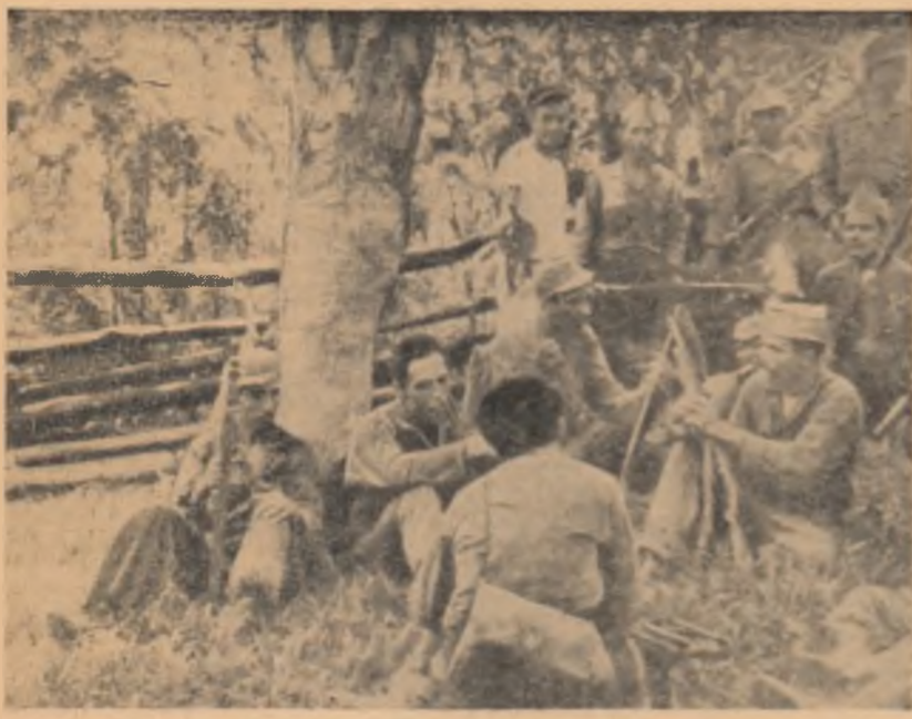
În fotografie: O unitate de patrioți din Guatemala care acționează în regiunea muntoasă Sierra de Las Minas, împotriva regimului dictatorial.