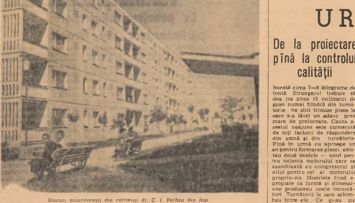
Clubul muncitorești din cartierul dr. C. I. Parhon din Iași

19.00: Jurnalul televiziunii; 19.15: Tonomatul lui Aschil; 19.50: Mamaia 1963 — reportaj filmat; 20.20: Precepătorul în încurcături. Operă burză; 21.45: Muzică ușoară. În încheiere: Buletin de știri, buletin meteorologic.