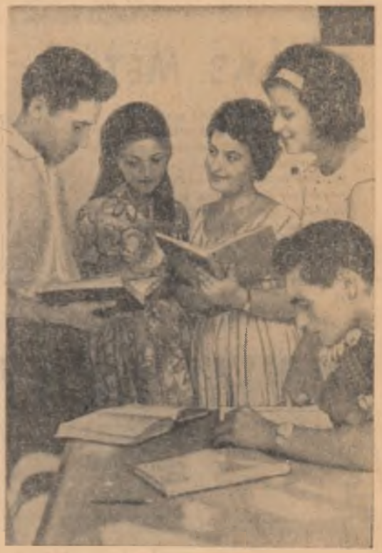
Candidatele la studenție, viitorii studenți la Institutul „Maxim Gorki” din Capitală se pregătesc pentru apropiatul concurs

Colectivul uzinei cocciniferice de la Comănești, județul Hunedoara a înscut ferocilor săi în luna august în medie zilnic cite 45 tone de coacă metalurgice peste plan, realizînd astfel cel mai înalt indice de utilizare a bateriilor de cocciniferare obținut în ultima vreme. Lucrătorii coccinierii obțin rezultate bune și în ce privește calificarea gazelor și a altor reziduuri rezultate în procesul de cocciniferare a carbureților. Din acestea ei au fabricat și livrat