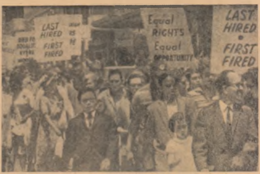
Recenti în Toronto (Canada) a avut loc un marș de solidaritate cu lupia negrilor din S.U.A. Această luptă și-o câștigat sprijinul forțelor democratice din Canada iar demonstrația din Toronto a fost o mărturie a acestei solidarități.

Se anunță, de asemenea, că buletinul de presă al oamenilor de știință atomiști americani, „Bulletin of Atomic Science”, a publicat un articol de fond în care subliniază că Tratatul de la Moscova cu privire la interzicerea experiențelor cu arma nucleară este o contribuție importantă la cauza păcii.