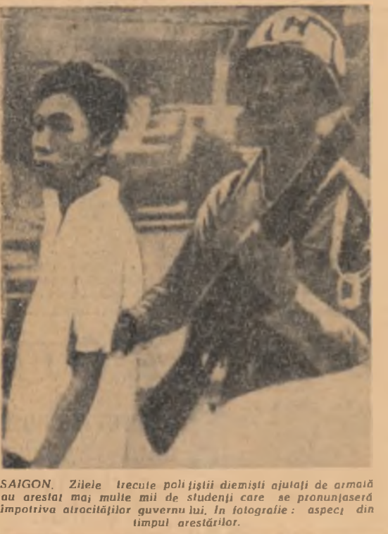
SAIGON. Zilele trecute poliștii diemști au jăluit de armată au arestat mai multe mii de studenți care se pronunțaseră împotriva atrocităților guvernului lui. În fotografie: aspect din timpul arestărilor.

„dacă i s-ar cere acest lucru”. Ziarele franceze de vineri dimineață interpretează declarațiile președintelui de Gaulle ca o încercare de a reintroduce influența franceză în Vietnamul de sud, unde, după cum se știe, locul Franței a fost luat de Statele Unite. „Le Figaro” însă și se referă la declarațiile lui de Gaulle vor fi primite cu neplăcere la Washington, deoarece sînt făcute într-un moment cînd Statele Unite se străduiesc să restabilească la Saigon o situație deja compromisă. De aceeași părere este și ziarul „L'Aurore” care se referă la „o nouă spîrtură în rîndurile occidentalilor” ca urmare a declarațiilor președintelui de Gaulle. „S-ar putea trage concluzia — subliniază în legătură cu aceasta ziarul „Combat” — că declarația lui de Gaulle nu trebuie considerată numai ca o nouă înțepătură la adresa Washingtonului și că ea poate duce la accentuarea politicii franceze de desprindere din alianța atlantică...”.