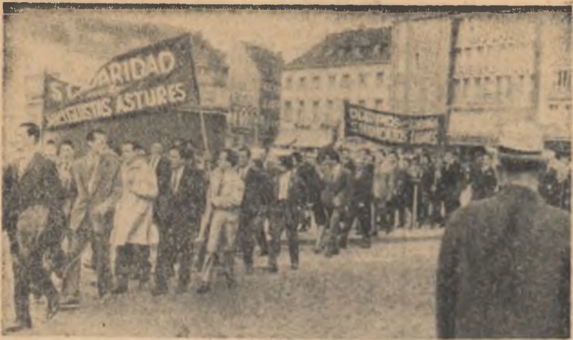
Recentele zile de muncitori spanioli care lucrează la Düsseldorf (R. F. Germană), au participat la o demonstrație de solidaritate cu greva muncitorilor din Asturia. Demonstrații purta următoarele lozinci: „Ne solidarizăm cu înviașii noștri din Asturia”, „Cerem sindacale libere în Spania” în fotografie: Aspect de la demonstrația din Düsseldorf.