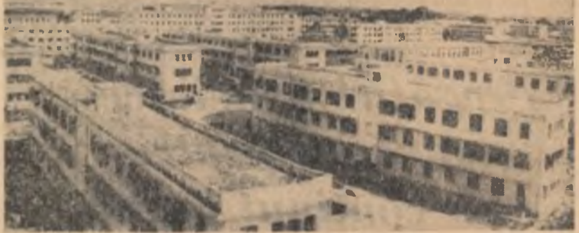
Fotografia noastră înfățișează un aspect dintr-un raion din Hanoi în care se află Institutul de agronomie și școala superioară financiară.

din Vietnamul de sud față de elica diemistă este meren mai puternică. Teroarea diemistă de demnitate nu poate înfringe lupta dreaptă pentru libertate a poporului din Vietnamul de sud. Patriei sud-vietnameze, ale căror războaie erese neînecate, sint sprizliti în lupta lor de întreaga opinie publică mondială iubitoare de pace. Într-o Republică Populară Română și Republica Democrată Vietnam s-au statornicit și se dezvoltă relații de prietenie și colaborare frățeskă întemeiate pe principiile internaționalismului proletar, a identității țărilor lor de construire a socialismului, pe aspirația comună de apărare a păcii. Relațiile dintre țările noastre servesc intereselor ambelor popoare, cauzei socialismului și păcii. Poporul nostru, împreună cu toate forțele iubitoare de pace din lume, sprizliti lupta poporului vietnamez pentru reunificarea patriei și democratice a țării sale, se pronunță hotărât pentru traducerea în viață a acordurilor de la Geneva cu privire la Vietnam. Cu prilejul celor de a 18-a aniversări a proclamării R. D. Vietnam, tineretul și poporul nostru transmit poporului frate vietnamez, al călduros saluți și îi urează noi succese în construirea socialismului, în lupta pentru reunificarea țării sale, pentru o pace durabilă.