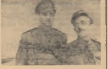
recomandăm filmul „Marele drum” din regia lui Iuri Ozerov. Distribuția filmului este bogată în actori cunoscuți și apreciați: actorul sovietic Iuri Iakovlev, cunoscutul actor ceh Jaroslav Hasek, interpretul rolului lui Hasek, cunoscutul actor ceh Jaroslav Hasek, interpretul rolului lui Hasek, cunoscutul actor ceh Jaroslav Hasek, interpretul rolului lui Hasek.

Filmul „Marele drum” este rezultatul colaborării cineaștilor sovietici și cehoslovaci în regia lui Iuri Ozerov. Regizorul marele scriitor ceh Jaroslav Hasek, autorul nemuritorului roman „Peripeziile hărușului anilor Svejk” formează subiectul filmului. Bazat pe logia autentică, filmul reconstruiește o perioadă de septe ani din viața scriitorului și anume epoca îndălnită din 1914-1921 în Rusia înfrîntă și momentul cunoașterii dintr-o Hasek și modelul viitorului erau al