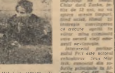
Helga în crănoașă din filmul „Nori albi”. Filmul este o lucrare prietenoasă deosebită a regizorului Ladislav Halas.

„Nori albi” este un film care prezintă viața și activitatea partizanilor slovaci împotriva hitleristilor în timpul celui de-al doilea război mondial. Filmul este o lucrare prietenoasă deosebită a regizorului Ladislav Halas.