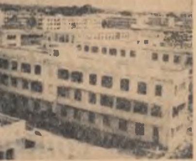
Fotografia noastră înfățișează un aspect dintr-un raion din Hanoi în care se află Institutul de agronomie și școala superioară financiară.

Dezvăluri privind represiunile antidemocratice din Spania. Comitetul mexican de sprijinire a deținuților politici din Spania a trimis șefilor delegațiilor țărilor membre ale O.N.U. o declarație și documente în legătură cu situația grea a deținuților politici din Spania și violarea sistematică de către regimul franchist a drepturilor elementare ale omului.