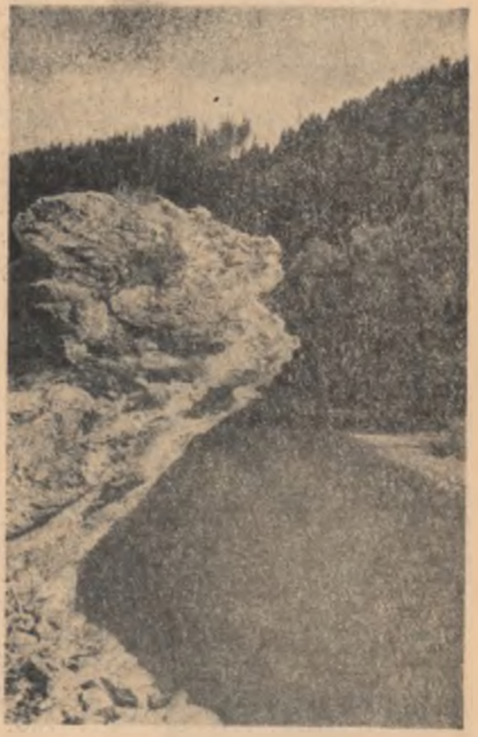
Și aici, Bistrița Inseamnă lot lumină..