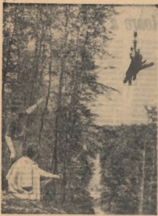
Aspect al uneia din liniile de tunculare ale întreprinderii testiere Sighet.

Intrevedea stagiile de masă a Sportachiadiei de vară a tineretului. Aceste activități sunt organizate în cadrul comitetului de tineret al asociației sportive.