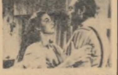
Filmul „Escondida” a fost realizat de regizorul Marie Felix și de scenaristul Ladislav Halas.

În filmul „Escondida”, producție a studiourilor mexicane, în regia lui R. Calvador, este înfățișată povestea de dragoste dintre doi tineri, pe fundalul luptelor (demonilor mexicani din 1911). Condițiile mizerabile în care trăiesc tinerii mexicani se întrerup între cei doi îndrăgostiții împiedicînd realizarea iubirii lor.