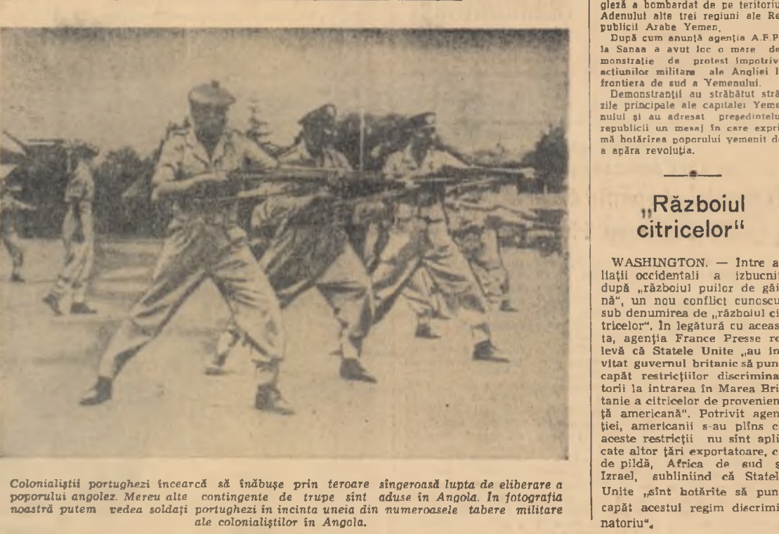
Colonialiștii portughezi încearcă să înăbușe prin teroare sîngeroasă lupta de eliberare a poporului angolez. Meru alte contingente de trupe sînt aduse în Angola. În fotografia noastră putem vedea soldații portughezi în incinta uneia din numeroasele tabere militare ale colonialiștilor în Angola.

WASHINGTON — Între ailații occidentali a izbucnit, după „războiul pulber de gălbui”, un nou conflict cunoscut sub denumirea de „războiul citricelor”. În legătură cu aceasta, agenția France Presse relevă că Statele Unite „au invitat guvernul britanic să pună capăt restricțiilor discriminatorii la intrarea în Marea Britanie a citricelor de proveniență americană”. Potrivit agenției, americanii s-au plîns că aceste restricții nu sînt aplicate altor țări exportatoare, ca de pildă, Africa de sud și Israel, subliniind că Statele Unite „sînt hotărîte să pună capăt acestui regim discriminatoriu”.