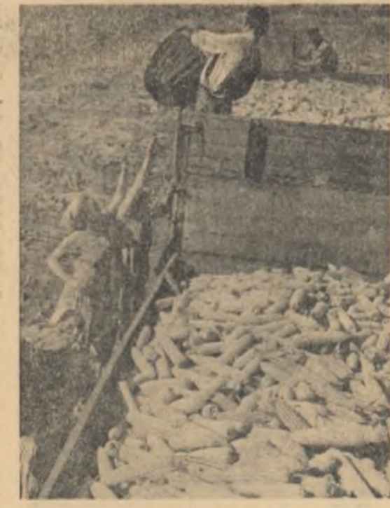
Sute de hectare pe zi — înseamnă sute și sute de remorci pline cu porumb din noua recoltă.