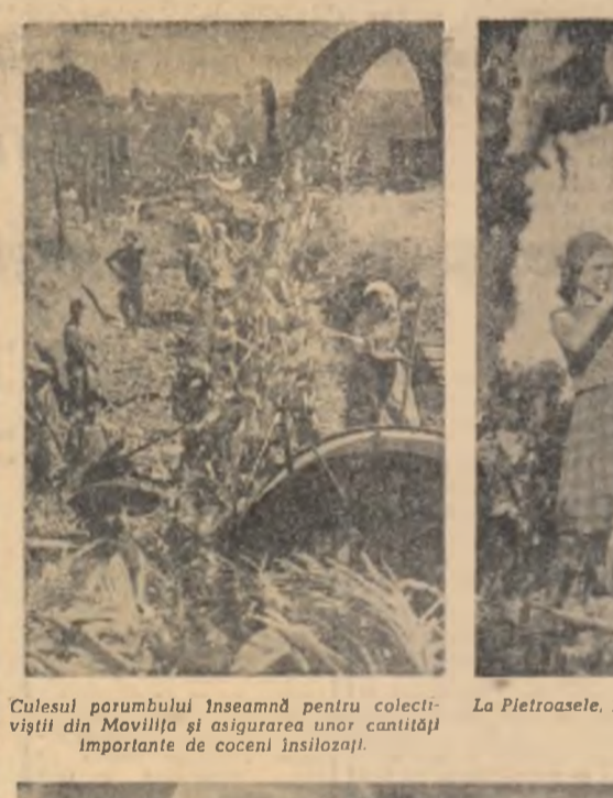
Culesul porumbului înseamnă pentru colectivitățile din Movilița și asigurarea unor cantități importante de cocii înșilozați.