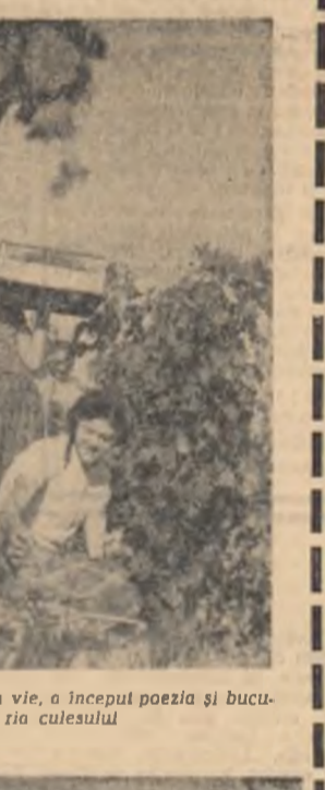
La Pietroasele. În vie, a început poezia și bucuria culesului