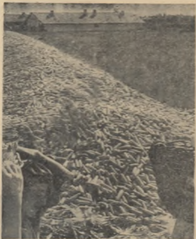
La G.A.C. „J. Văduțeanu” din comuna Călnăci, regiunea București, gândește de timpuriu să crească cantități cât mai mari de coceni în silozuri în cel mai scurt timp posibil.

Recoltarea porumbului trebuie să fie terminată în cel mai scurt timp pentru ca să se poată efectua la vreme arăturile și însămînțările de toamnă. Dăruțiți toate eforturile, toată capacitatea voastră de muncă pentru realizarea acestui obiectiv! Participați activ la culesul știuleților, tăiatul cocenilor și transportarea acestor produse! Sprijiniți transportul operativ al boabelor la silozuri și la bazele de recepție!