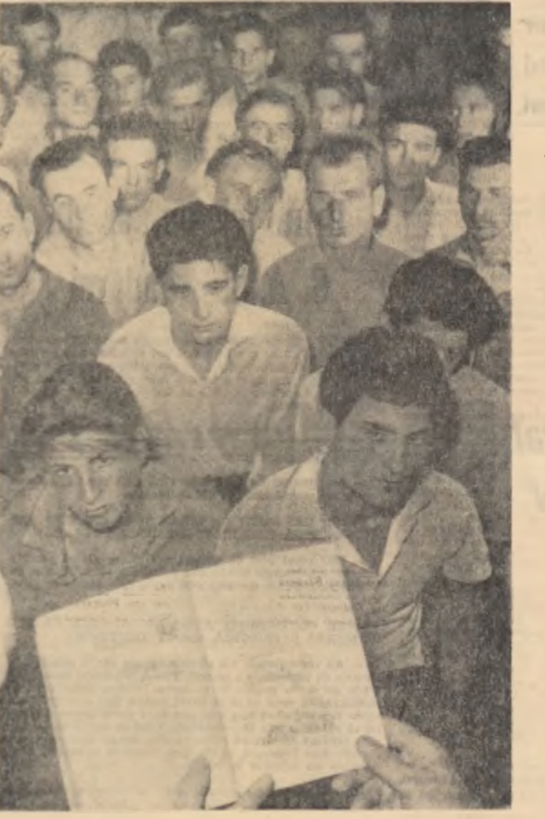
Printre activitățile ce se desfășoară la clubul Șantierului Băi-radiatoare București, se înscru și cele prezentate în sprijinul pregătirii profesionale în fotografie: un aspect din timpul prezentării teatralului tehnic. „Despre căile de creștere a producției muncii”