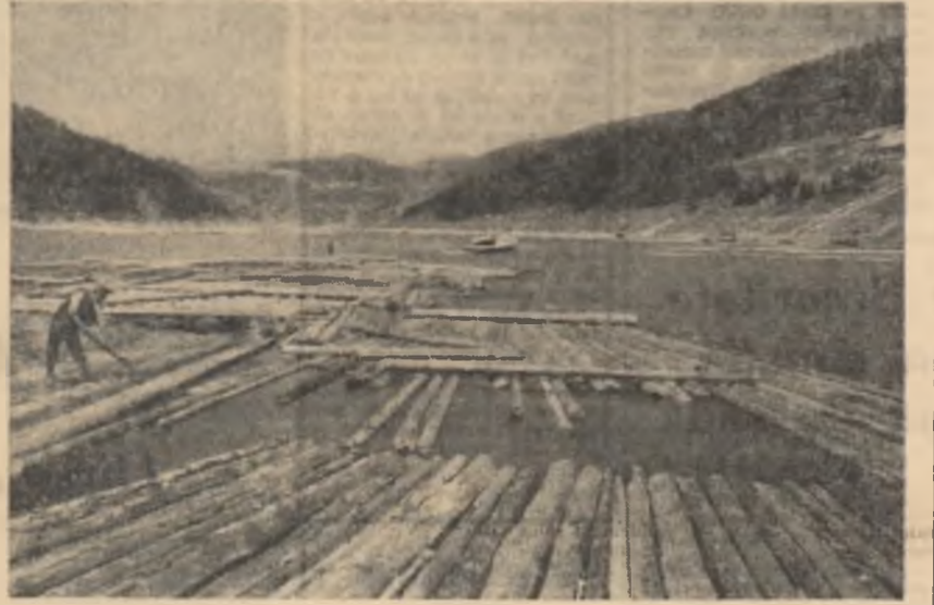
Transportul și manevrarea plutei pe lacul Bicaș