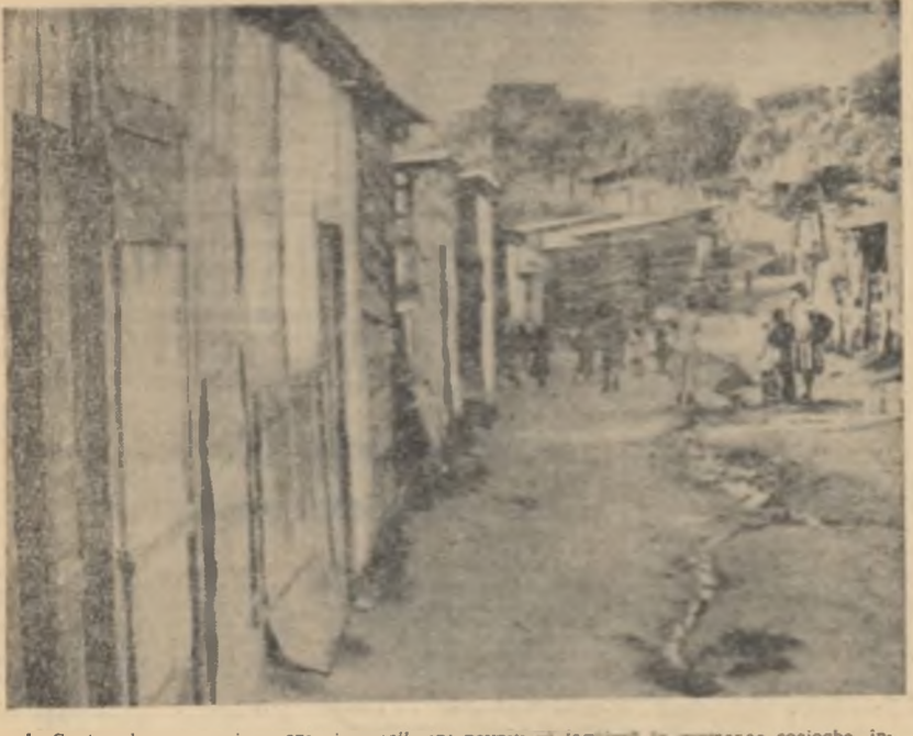
În Gualamala, numeroși oameni ai muncii sînt nevoiți să locuiască în casele cocioabe, întrucît nu au locuințe proprii.

la viața a milioane de oameni”, subliniînd că ele „sînt contrare spiritului existent în lumea după semnarea Tratatului de la Moscova, prin care sînt interzise experiențele nucleare în trei medii”. Federația a chemat toate organizațiile studențești de pe continentul american și din lumea întreagă să organizeze o mișcare internațională de protest împotriva acestor experiențe.