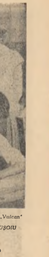
Pașă din meciul Universitatea Timișoara — Institutul pedagogic Pitești eligibil de timișoreni cu scorul de 3-0.