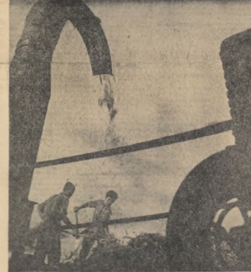
Îndată după culesul știuleților, colectiviștii din Porumbului, regiunea Maramureș, recoltează cocenii pe care-i însilozează în amestec cu alte nutrețuri, asigurînd astfel importante rezerve de furaje pentru animalele proprietate obștească