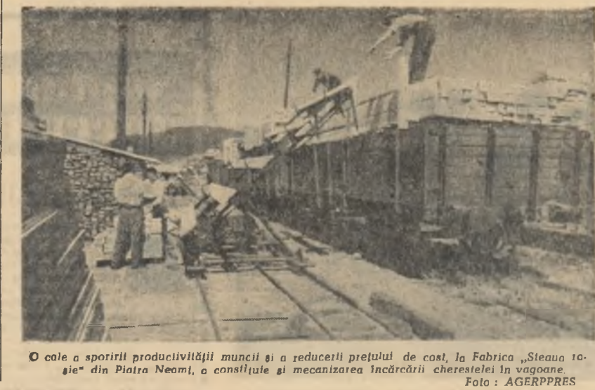
O cale a sporirii productivității muncii și a reducerii prețului de cost, la Fabrica „Steaua” din Piatra Neamă, a constă în mecanizarea încălzirii chereștelor în vagoane.