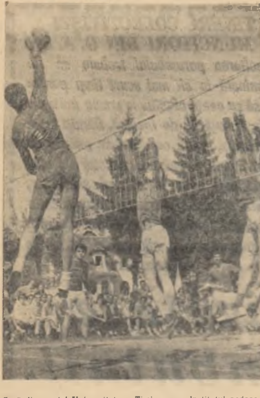
Pașă din meciul Universitatea Timișoara — Institutul pedagogic Pitești eligibil de timișoreni cu scorul de 3-0.