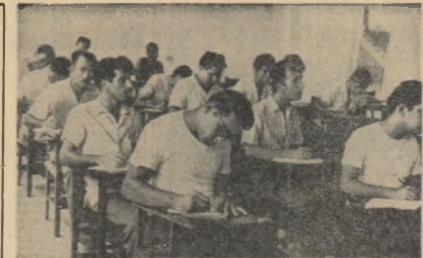
CUBA. În cadrul Universității Centrale din Las Villas funcționează o facultate de agronomie înzestrată cu laboratoare și utilități moderne. În fotografie: Candidații care se pregătesc pentru admiterea la Facultatea de agronomie, urmează în prealabil unele cursuri de cultură generală.

„Sunt Mărio secretarul general al Federației, a dat publicității următoarea declarație: „Către conducătorii politici și tinerii și tineretele din