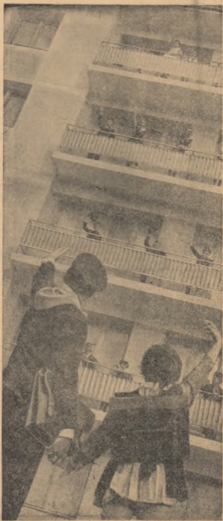
Așteptați-ne, venim și noi la școală...