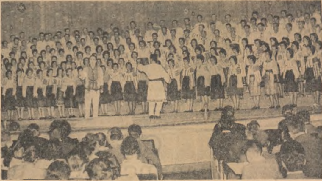
Un aspect din timpul spectacolului

O sărbătoare a tuturor: deschiderea școlilor