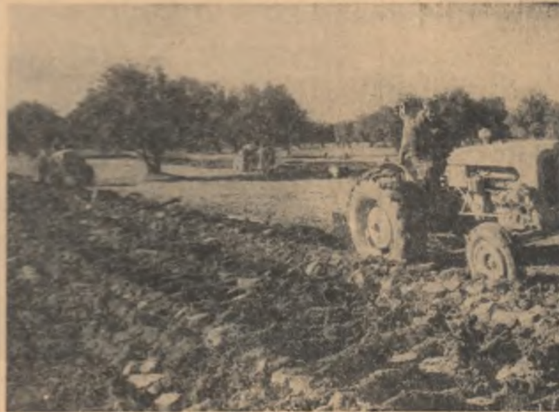
ALGERIA. Viste terurii se potrivește, care aparținere fo-