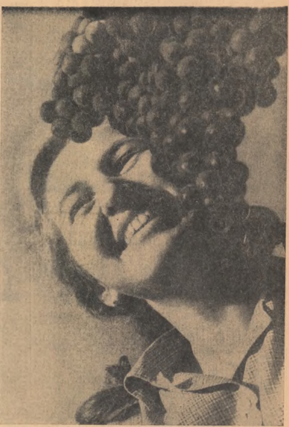
Plină de miresme, de bucurii a venit toamna. Tineretea o primește cu vesela încreșcată, culegîndu-și roadele.

Cititi În pag. 2-3: In munca patriotică a tineretului — cît mai multă eficiență! (Insemnări de la plenara Comitetului regional U.T.M. - Maramureș).