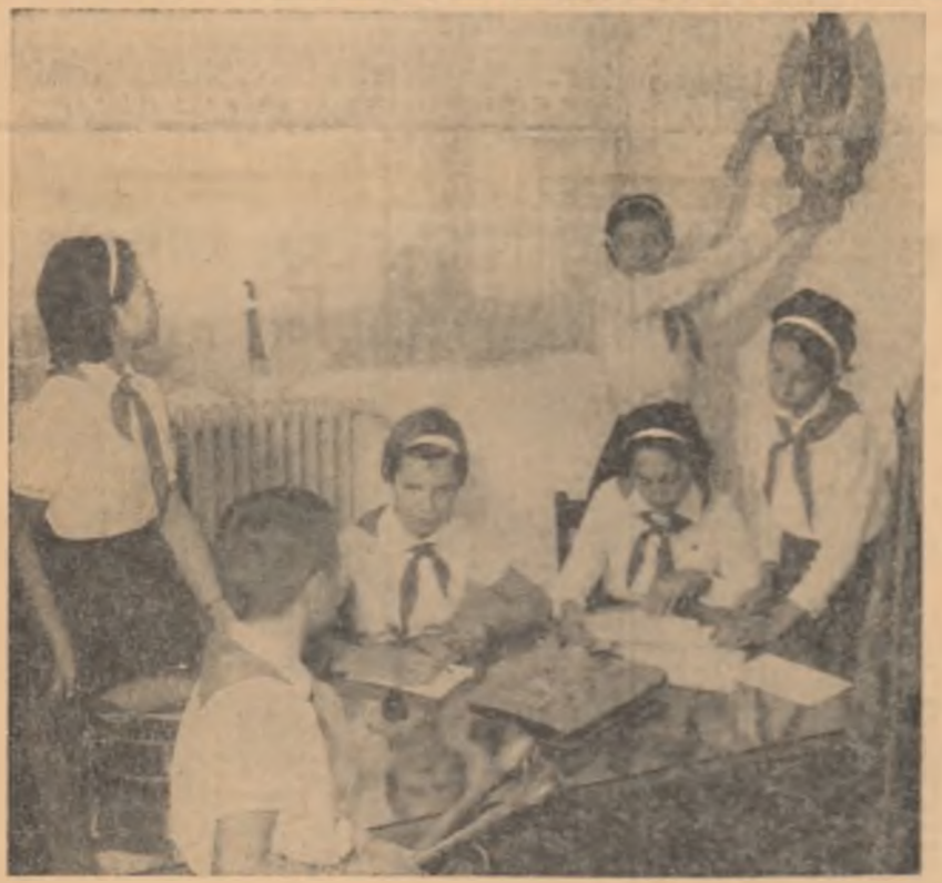
Un loc îndrăgît de copiii de la Școala medie nr. 33 din Capitală: camera pionierilor. Acum, la început de an, pionierii lucrează cu mult drag la amenajarea plăcută a sedințelor lor.

Întinam cu via — în anotimpul toamnei, cînd e lumina coaptă în aer și o tîrnă ca ciorchinii gri de-aluzalec. Poate că soarele descrește în strălucire și căldură, prea împărțit de lanuri și de tucule; poate că se retrage în biroulul tîrnii, să-și strîngă iar puterea pentru vară.