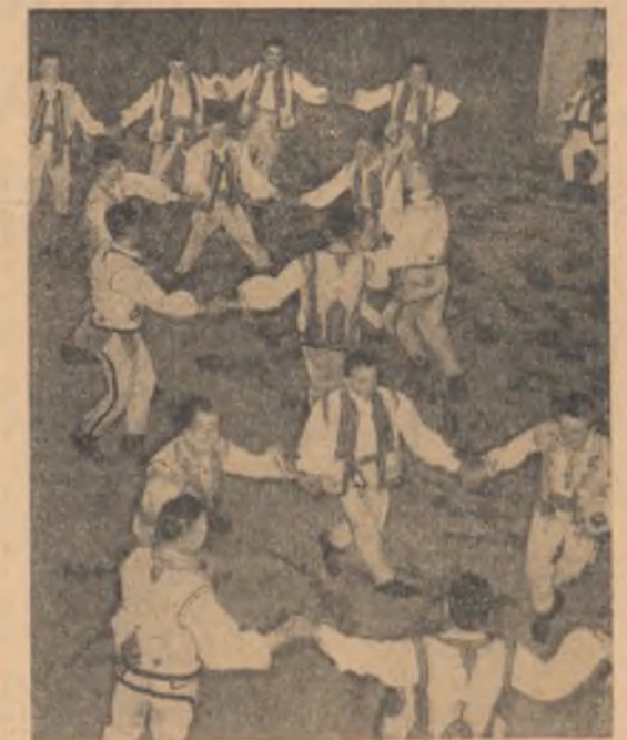
În iureșuri dansului, pe scena linaletului de-al XII-lea concurs al formațiilor artistice ostășești.