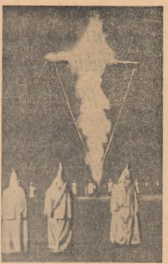
Ardeea unei cruci în miez de noapte — îndeplinirea curentului a zasilor din statul Alabama (S.U.A.), învesmintă în uniformele Ku-Klux-Klanului

ROMA — La 24 septembrie în „Palatul Congreselor” de la Roma s-a deschis lucrările celui de-al XVII-lea Congres mondial de luptă împotriva tuberculozei. La congres participă peste 3.000 de oameni de știință și lucrători ai instituțiilor medicale din 77 de țări ale lumii, dintre care și R. P. Romine.