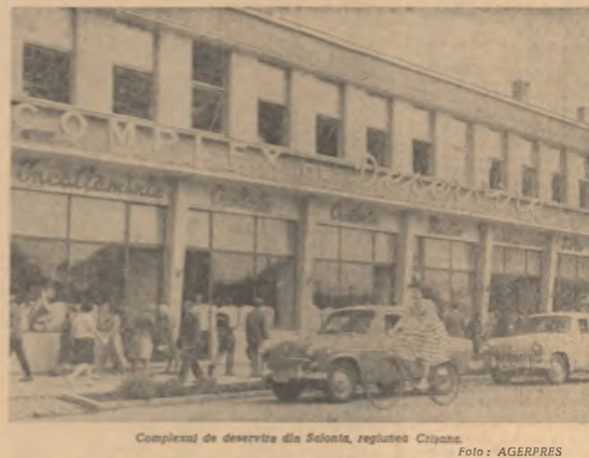
Complexul de servicii din Sîntia, regiunea Crișana.