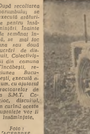
După recoltarea porumbului se execută arăturile pentru însilozarea cocenilor. Înainte de semănaș în să, se mai face una sau două lucrări de discuit. Colectivizatii din comuna Tîncăbești, regiunea București, execută acum, cu ajutorul tractoarelor de la S.M.T. Căcărăni, discuitul. În curînd aceste suprafețe vor fi însilozate.

amestec cu diverse resturi vegetale. Totuși, timpul însinat și faptul că în fiecare zi ce trece procentul de umiditate din coceni scade, impune urgentarea lucrărilor de însilozare. În fiecare unitate agricolă socialistă există posibilitatea realizării unei viteze și a unei cantități de lucru mult sporite; chiar și în gospodăriile colective fruntașe. Pentru aceasta însă este necesar ca stațiunile de mașini și tractoare să ia fără nici o întrerupere mîsurii (prin amenajarea de atelier mobile și prin mai buna utilizare a celor existente) pentru repararea operativă a tractoarelor de nutreț. La Căcărăni, de exemplu, nu lucra decît o toacătoare (fapt care a făcut ca pînă acum să se însilozeze numai 120 de tone de coceni din 400 planificate), la Răușeni alie 4 toacătoari nu puteau fi folosite și așa mai departe. Prin mobilizarea tuturor tinerilor colectivizati, și de se la muncă în G.A.C., prin îndrumarea lor spre pasturii de lucru care cer mai multă operativitate (la tîlăștii cocenilor, transport, tocat) organizațiile U.T.M. din G.A.C. pot aduce o contribuție mult mai mare la desfășurarea într-un ritm mai rapid a acestei importante acțiuni. AURELIA CĂRENTU correspondentul „Scînteia tineretului” pentru regiunea Suceava