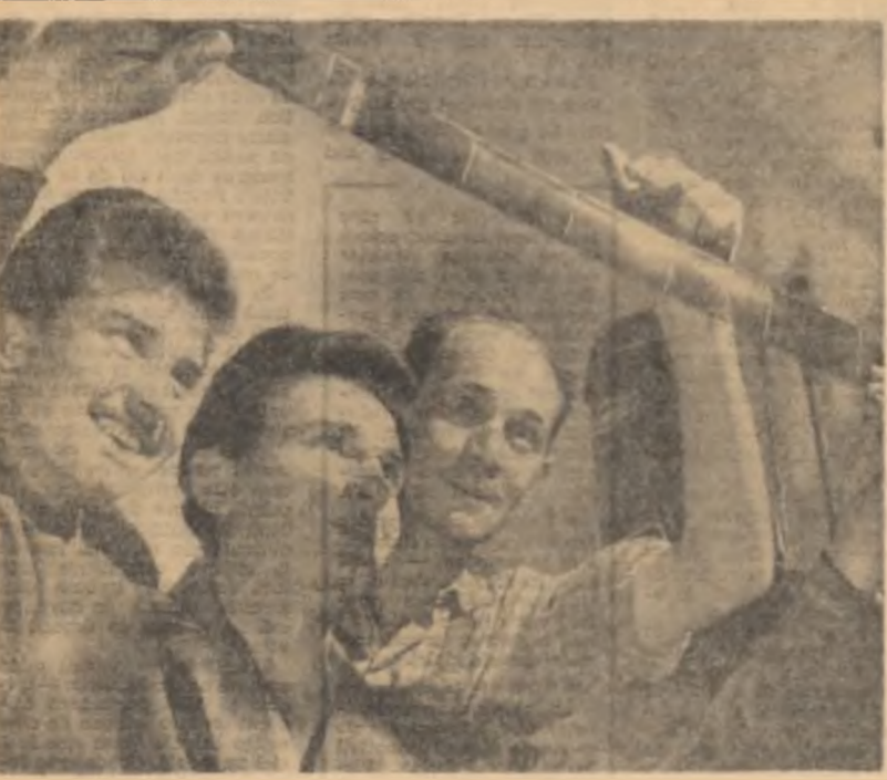
Imaginile celei mai proaspete pelicule au prins parca viață în milniile tinerilor de la cercul foto al fabricii de ullaie și piese de schimb — Metalotehnica din Tg Mures.

Fotografiile oferite în dar muzeului se aflau în albumul care fusese dăruit familiei Lartague de Jenny Marx, fiica cea mai mare a lui Karl Marx.