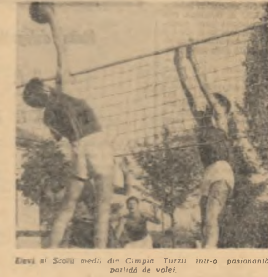
Atleți și școlii medii din Cimpia Turzii într-o pasionantă partidă de volei.