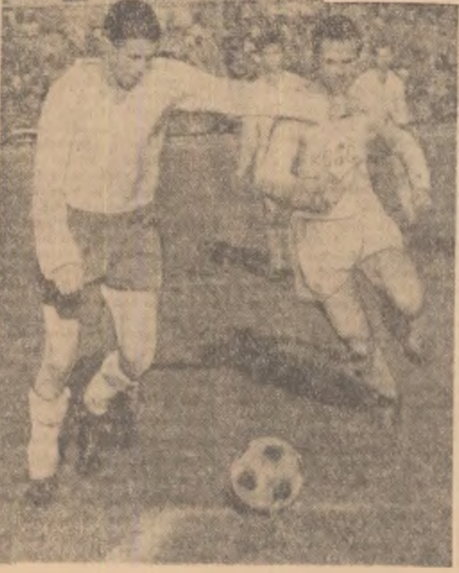
Pircăb sutează la poarta formației Siderurgistul.