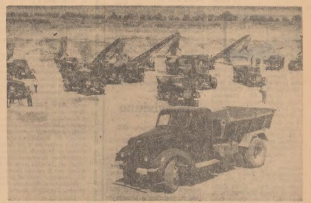
Din balastiera Bragadiru pleacă zilnic zeci și zeci de basculante (circa 2.500 m c) încărcate cu pietriș, nisip și balast necesar șantierelor de construcții din Capitală.