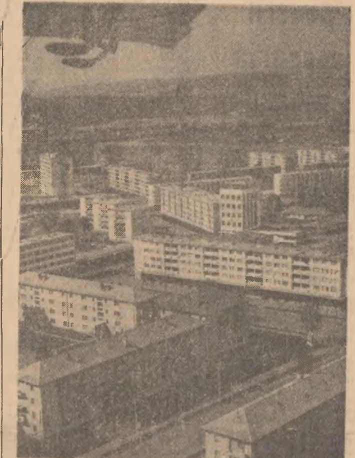
Orașul Onești văzut parțial din avion