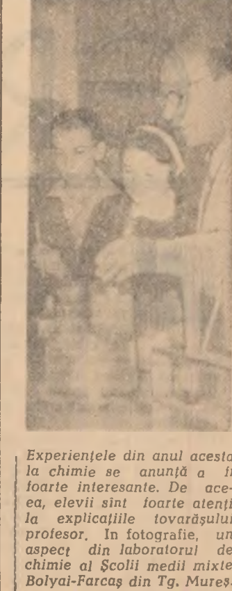
Experițele din anul acesta la chimie se anunță a fi foarte interesante. De aceea, elevii sînt foarte atenți la explicațiile tovarășului profesor. În fotografie, un aspect din laboratorul de chimie al școlii medii mixte Bolyai-Farcaș din Tg. Mureș.