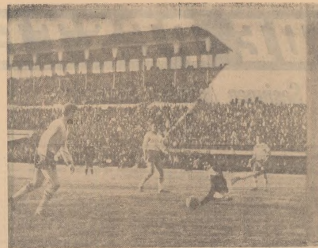
O fază de la meciul dintre Selecționata olimpică de fotbal a R. P. Romine și Fortuna Geleen (Olanda) disputat la Ploiești.