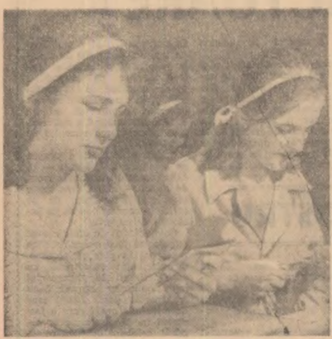
Primele ore de practică la Școala profesională de pe lângă Uzina de piei și încălziminte din Cluj

Din propria-mi experiență de elev și apoi din cea de profesor, știu că tinerii își pun din primele clase de școală o întrebare asu-