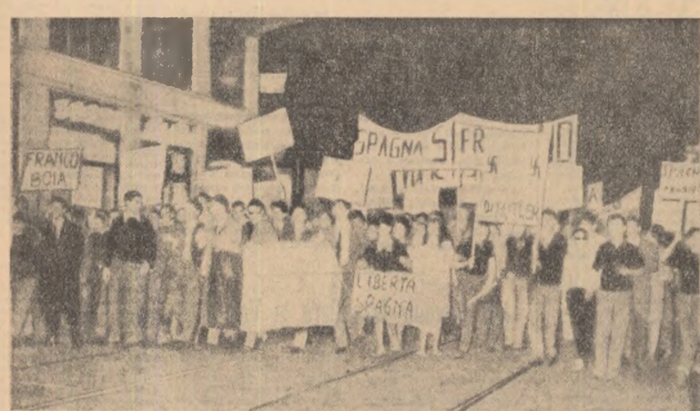
ITALIA. Demonstrație anti-rasistă a tineretului din Milano

După cum transmite agenția Prensa Latina, poliția din Caracas a ocupat redacția ziarului „Clarín” și a sechestrat ultimele ediții ale acestui ziar.