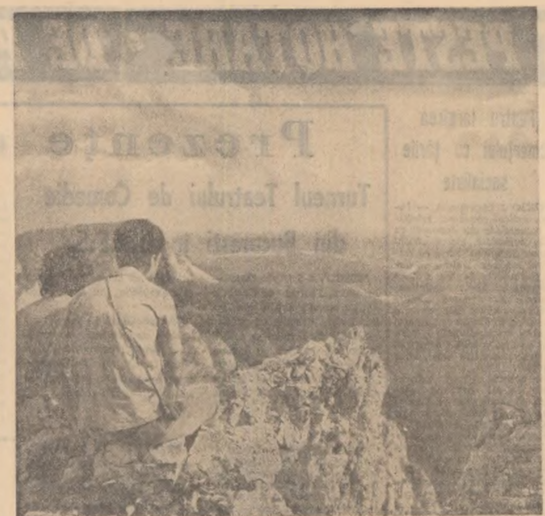
In munții Hôghimoșului

Noi sîntem convinși că, luînd asemenea măsuri, calitatea produselor noastre se va îmbunătăți și mai mult satisfăcînd pe deplin exigențele cumpărătorilor.