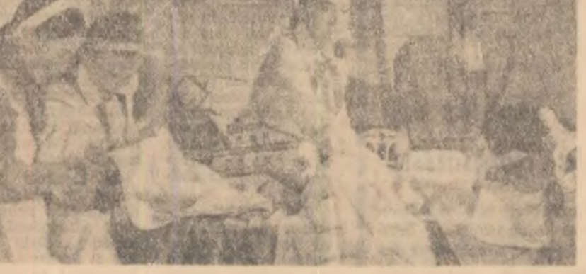
La Școala de 8 ani nr. 151 din Capitală activul pionieresc al detasamentului VI se pregătește pentru ieșiri. În cinstea acestui eveniment ei organizează o expoziție cu lucrări ale pionierilor