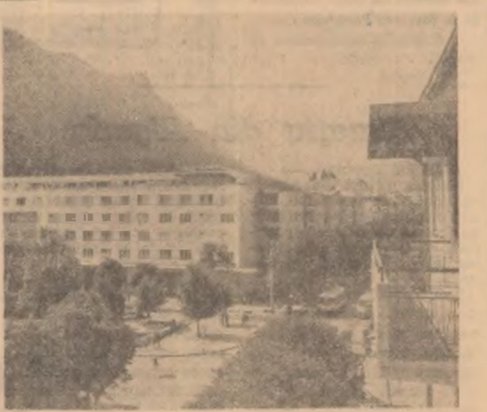
Din noul peisaj al orașului Brasov

Conform instrucțiunilor în vigoare muncitorii trimisi în alte localități pentru a urma școala tehnică de maștri — cursuri școlare — vor fi încadrați în întreprinderile din localitatea în care funcționează școala în aceeași categorie de salarizare avută la întreprinderea de la care provin. După absolvire vor fi încadrați din nou la întreprinderea care i-a recomandat.