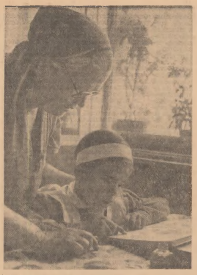
Rolurile s-au inversat. Bunica ascultă și nepoata povestește. Numai că nepoata nu spune o poveste, ci repetă primele lecții din viața de școlar.

„Cupa U.R.S.S.” competiția de închidere a sezonului ciclist pe velodrom, a reunit la Simferopol pe cei mai buni alergători sovietici. La viteza s-a impus din nou tânărul Omar Pakhadze, care l-a învins pe campionul țării Imants Bodnieks, parcursînd ultimii 200 metri în 1'16"10. La următoarea etapă a competiției, Dinamo Moscova — 4000 m în 4'38"210, iar la urmărirea individuală Tereschenkova — 4000 m în 5'04"4/10. Proba de semifond (100 ture) a revenit lui Boris Arhipov, urmat de Stanislav Moskvîn.