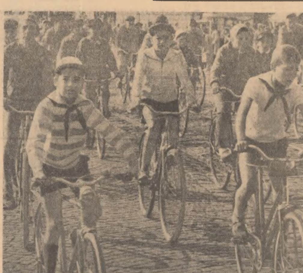
Duminică dimineața un grup de cicliști bucureșteni (elevi din școlile raionului Lenin) au pornit în prima excursie de toamnă