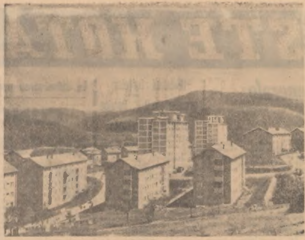
Înălțimi noi în lunca Pomosului