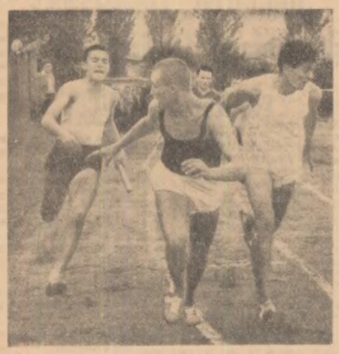
Schimbul de stiletă în proba masculină de 4x100 m