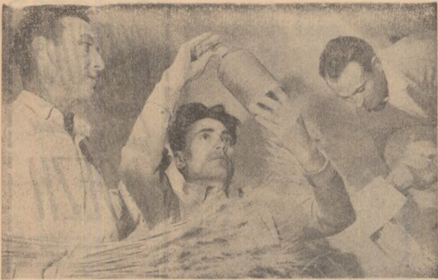
Pentru gospodăria colectivă din Lehiu-sat, regiunea București, casa-laborator este un fel de unitate de cercetare. Acum, în pragul deschiderii noului an de învățământ agrozootehnic, casa-laborator este reamenajată, îmbogățită cu noi aparate, mulaje, planșe, mostre de cereale și altele. Aici cursanții își vor petrece o parte din timpul liber pentru studierea mai profundă a problemelor pe care le vor rezolva lecțiile predate. Astfel ei vor învingea armonios practica muncii zilnice cu teoria.