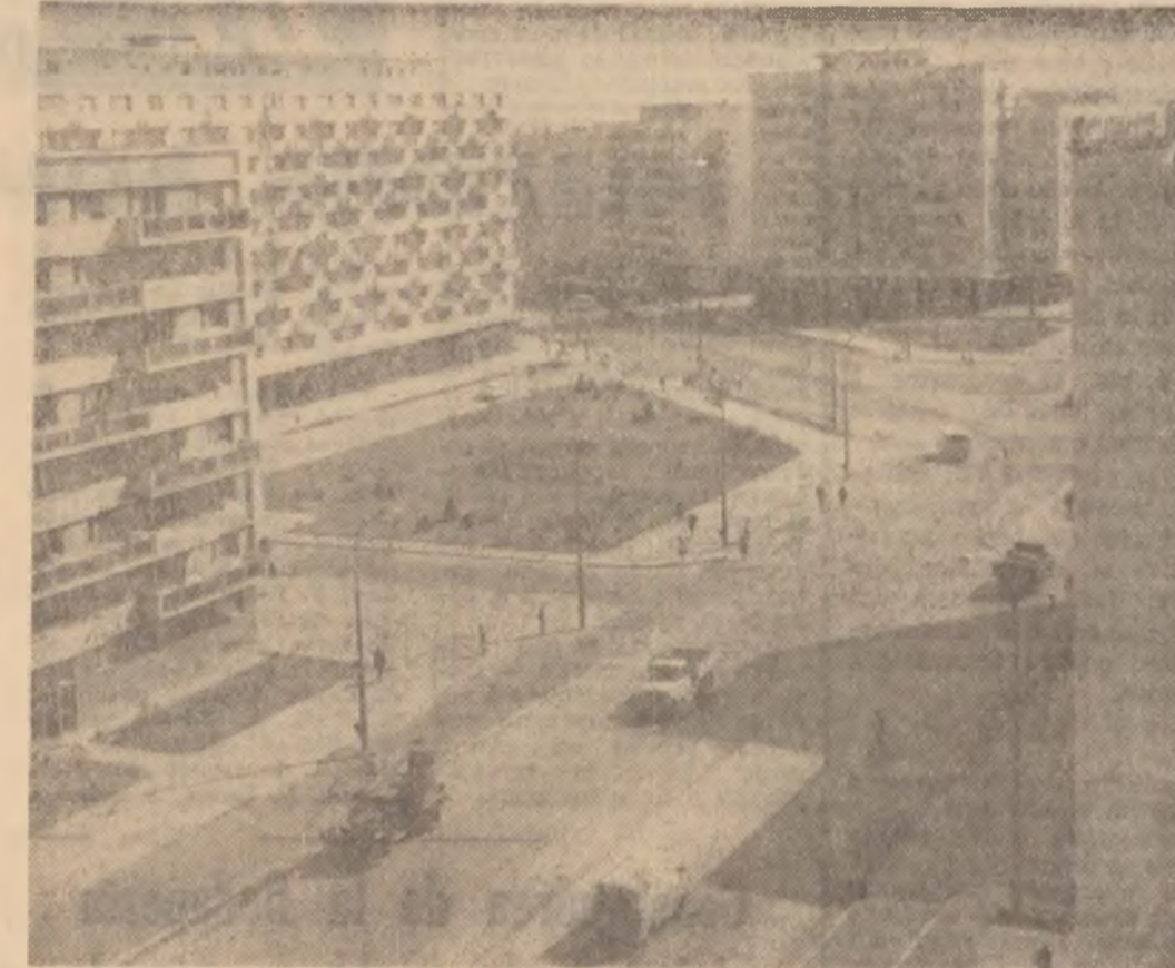
București | Piața Chibrit

Prin strădanile Electrocordului, opera enesciană este larg difuzată în mase pe calea discului. În vasta antologie sonoră închinată muzicii lui Enescu, Casa bucureșteană de discuri a oferit iubitorilor muzicii în execuția a 10 cunoscuți artiști bucureșteni imprimarea celebrului Dixtuor, pentru instrumente de suflat. Conceput în 1908, Dixtuorul este rezultatul unei din încercările enesciene de a cuprinde în tiparele unui vestiment armonios, într-o clasică formă arhitectonică, frumusețea cu totul deosebită a melodiei populare românești. După Rapsodia, Suita I-a, Enescu încearcă să valorifice intențiile românești în genul muzicii de cameră. În cadrul acestui gen, bazat tocmai pe independența melodică a vocilor, tolosind cu o inegalabilă măiestrie re-