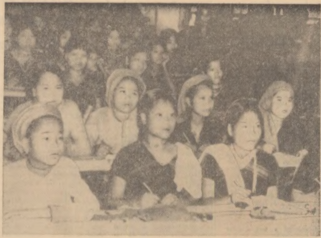
VIETNAMUL DE SUD: În regiunile eliberate de forțele patriotice, reprezentînd 2/3 din suprafața țării, înlocuiește o nouă viață. În fotografie: Aspect de la un curs pentru instruirea populației din regiunile eliberate.

Conducerea I. F. Stîlbeni și-a propus să analizeze periodic și să acorde pe viitor o mai mare atenție producerii manganului de boacă pentru ca acesta să satisfacă cerințele și exigența crescînde ale beneficiarului. Personalul nostru tehnic, muncitorii, care concurează direct la fabricația acestui sortiment au hotărît să facă din produsul expediat de noi un titlu de mîndrie și cinste.