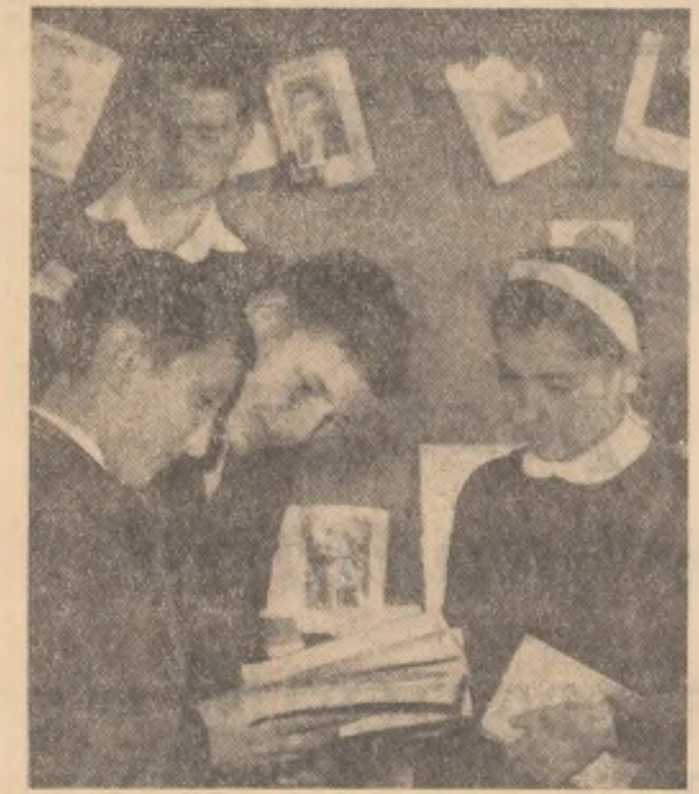
Un aspect obișnuit de la Biblioteca Școlii medii nr. 2 din Bacău. Mulți elevi își petrec alături timpul liber în tovărășia cărților.