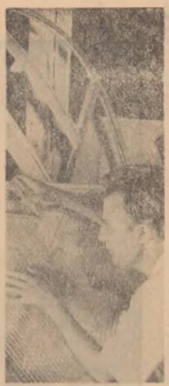
Montarea corzilor pianului e o operație prelungită. Conținutul de instrumente muzicale „Doina” din Capitală acordă de aceea maximum de atenție acestei operații