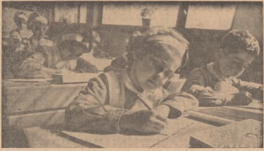
Primele litere cer o atenție încordată.