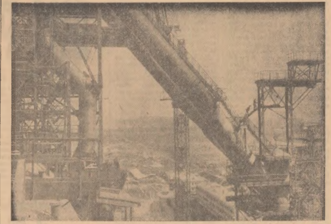
U.R.S.S. La uzinele metalurgice din Sibir apuseană se construiește un furnal de mare capacitate. În prezent se montează construcțiile de metal care au o înălțime de 70 m. În fotografie: Vedere generală a șantierului de construcții a furnalului.

În conformitate cu punctul 3 al articolului 3 al Tratatului privind interzicerea experiențelor cu arma nucleară în atmosferă, în spațiul cosmic și sub apă, participanții inițiali la acest Tratat, guvernele Uniunii Republicilor Sovietice Socialiste, Regatului Unit al Marii Britanii și Irlandei de nord și Statelor Unite ale Americii au predat la 10 octombrie 1963 guvernelor de depozitare, spre păstrare, instrumentele lor de ratificare ale acestui Tratat, respectiv guvernului Uniunii Republicilor Sovietice Socialiste, Regatului Unit al Marii Britanii și Irlandei de nord și Statelor Unite ale Americii. Tratatul prevede că orice stat care nu a semnat Tratatul înainte de intrarea lui în vigoare, poate adera la el oricînd. Tratatul prevede, de asemenea, că pentru statele ale căror instrumente de ratificare sau documente de aderare vor fi predate spre păstrare după intrarea în vigoare a Tratatului, acesta va intra în vigoare în ziua acestei predări. (Agerpres)