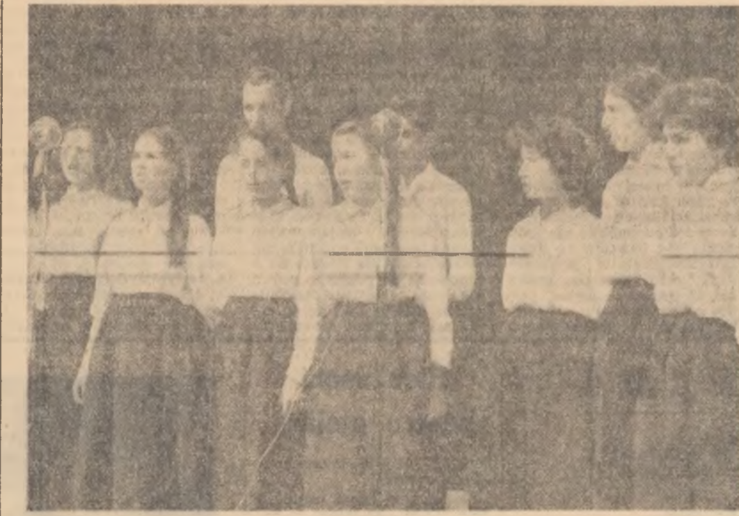
Grupul vocal al cîminului cultural din Comana, raionul Giurgiu.

Acest lucru l-a avut în vedere consiliul de conducere al G.A.C. Dăbica, din raionul Gherla cînd, încă înainte de începerea semăntului, a întocmit un plan de muncă amănunțit în care s-au stabilit lucrurile precise. Gospodăria are de însămînțat, în această toamnă, 420 hectare din care 365 cu grîu, 50 cu orz și 5 cu diferite culturi pentru masă verde. Pentru ca însămînțările să se poată termina în epoca optimă,