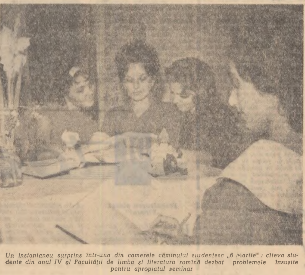
Un instantaneu surprins într-una din camerele căminului studentesc „6 Martie”: cîteva studenți din anul IV al Facultății de limbă și literatură romînă dezbăt problemele înșușite pentru apropiatul seminar

Marți după-amiază la Uzinele „Carbochim” din Cluj s-au deschis cursurile universității muncitorești. Anul acesta, în regiunea Cluj, sînt organizate 15 universități muncitorești, la care sînt înscriși un număr mult mai mare de oameni ai muncii decît în anul trecut, trei