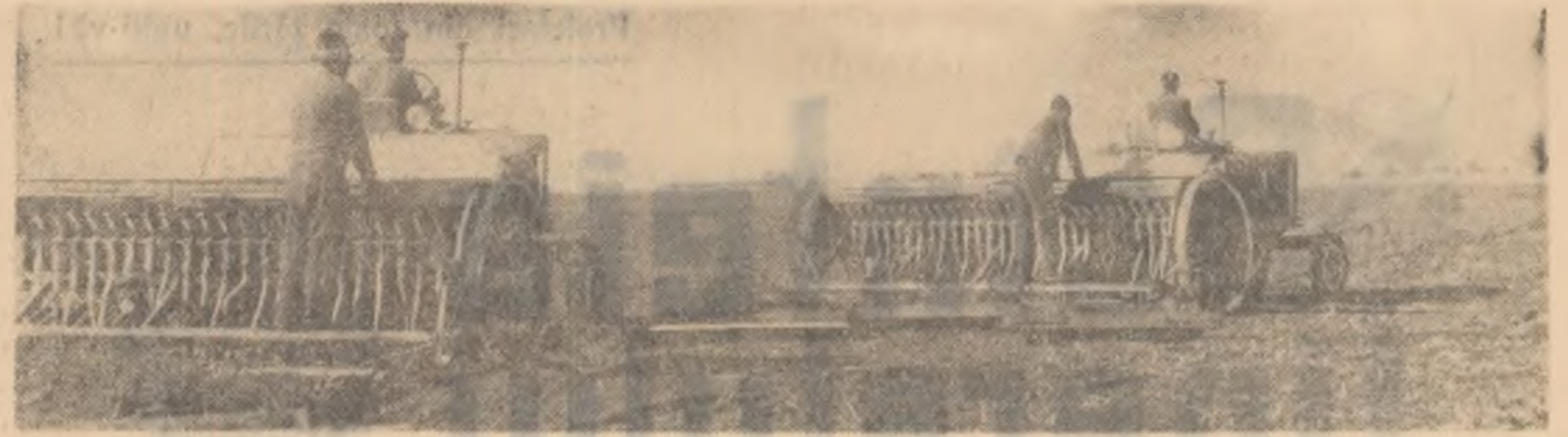
Intr-un pamint bine măruntit, mecanizatorii însămînțează grul pe ogoarele gospodăriei colective din comuna Ologi, raionul Tg. Măgurele.