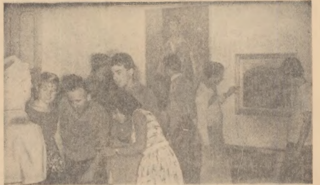
Tineri de la Uzinele „Independența” din Sibiu, în vizită la Muzeul „Brukental” din oraș.