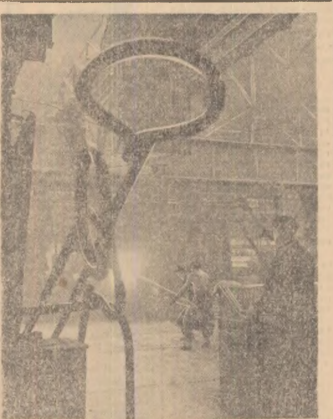
Se elaborează o nouă șarfă la Uzinele „23 August” din Capitală.

de studiu și de cercetare științifică. În anul viitor furnaliștii vor elabora, de asemenea, mărci noi de fontă care cer un proces tehnologic deosebit, proces care trebuie cunoscut temeinic din timp de toți muncitorii de la furnale. La ambele turnătorii, prin continuarea mecanizării, prin introducerea în fabricație a unor noi produse, productivitatea muncii va crește, se va îmbunătăți și mai mult calitatea produselor noastre. În vederea reducerii procentului de sulf