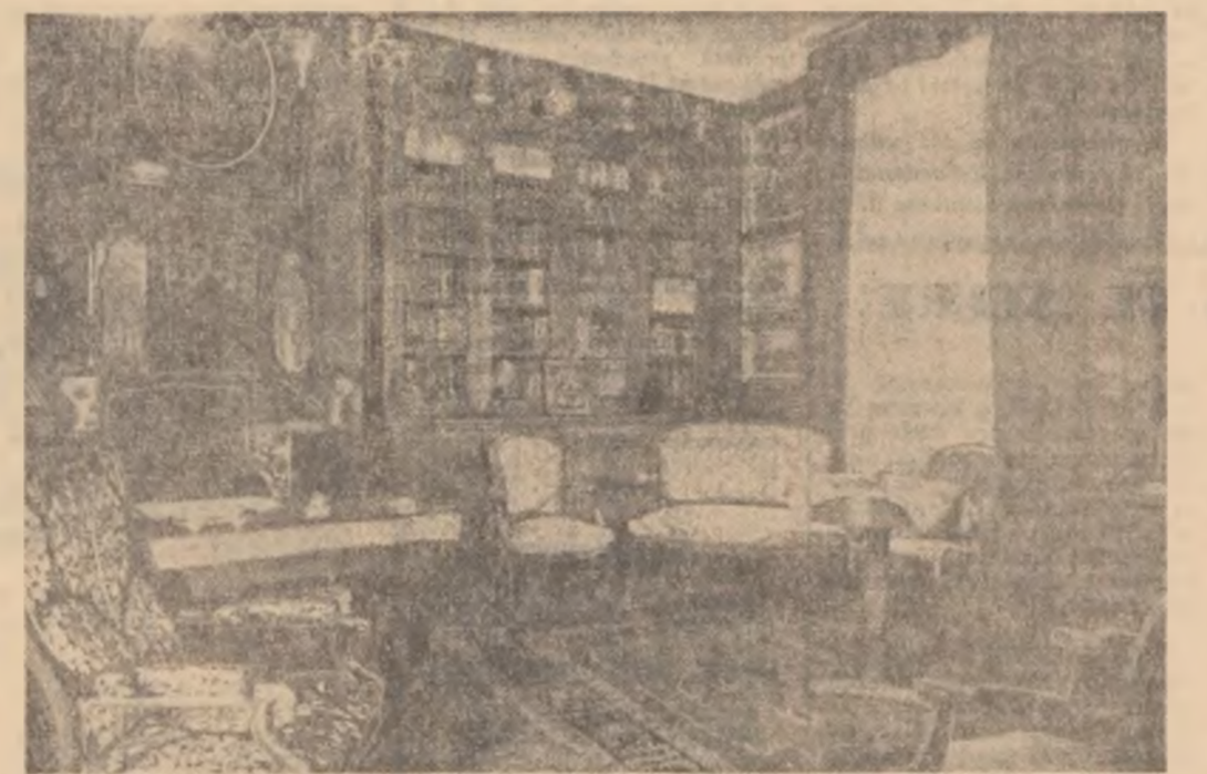
Într-una din sălile muzeului

au fost amenajate săli spațioase dotate cu mobilierul necesar, există material didactic pentru demonstrații practice (diferite probe de fontă, de zgură, piese executate corect sau rebutate din diferite cauze, planșe, schițe etc.). În cîteva secții, în deosebi la turnătorii, s-au luat măsuri pentru asigurarea condițiilor necesare efectuării demonstrațiilor „pe viu”, care vor contribui la o mai temeinică însușire a cunoștințelor și deprinderilor profesionale de către fiecare cursant în parte. Există astfel asigurate toate condițiile ca, la Uzinele „Victoria” din Calan, cursurile de ridicare a calificării — important obiectiv al planului de măsuri tehnico-organizatorice pentru 1964 — să fie deschise pînă la sfîrșitul acestei luni.