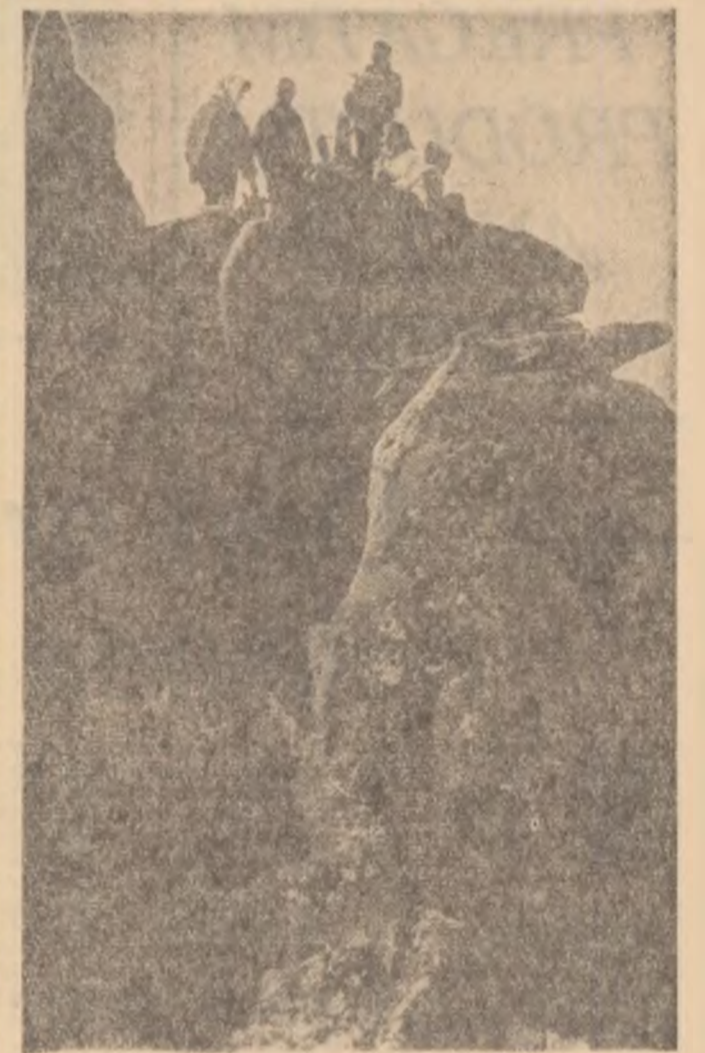
In excursie pe Retezat