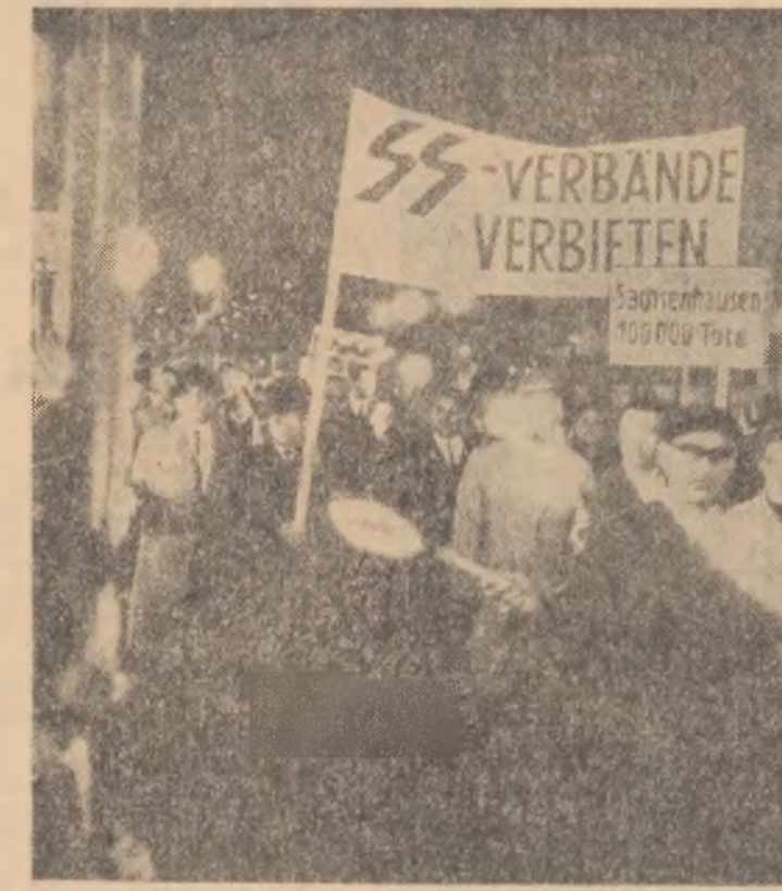
Recent, în centrul orașului vest-german Frankfurt pe Main a avut loc un marș al tăcerii în memoria victimelor fascismului. În fotografie: aspect din timpul marșului.