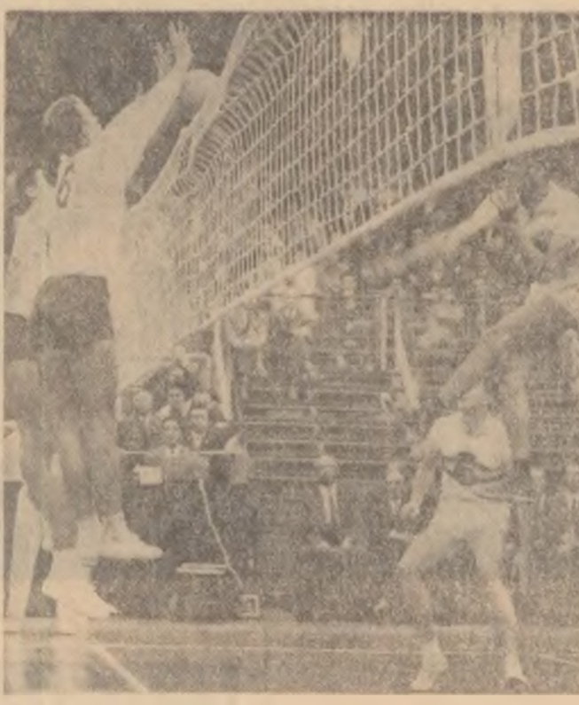
Vă prezentăm o imagine din prima zi a „europenelor” de volei disputate în sala sporturilor „Floreasca”