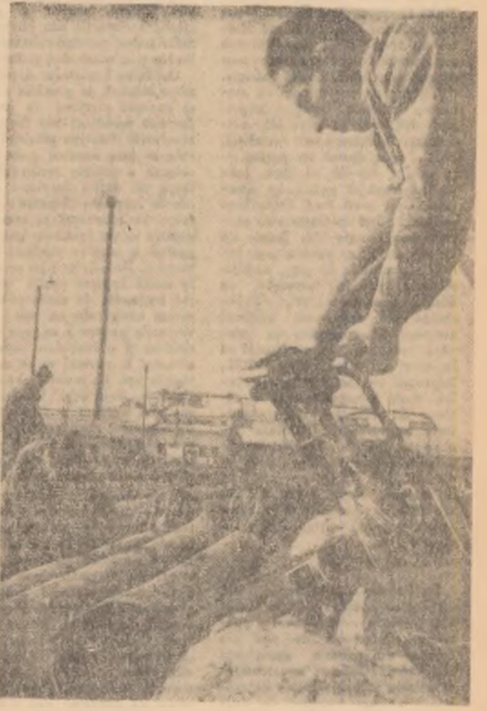
Zilnic, în depozitul final al I. F. Reghin se sortează peste 350 m.c. material lemos. Pentru buna desfășurare a muncii, întreprinderea a fost dotată cu utilaje de înaltă productivitate.