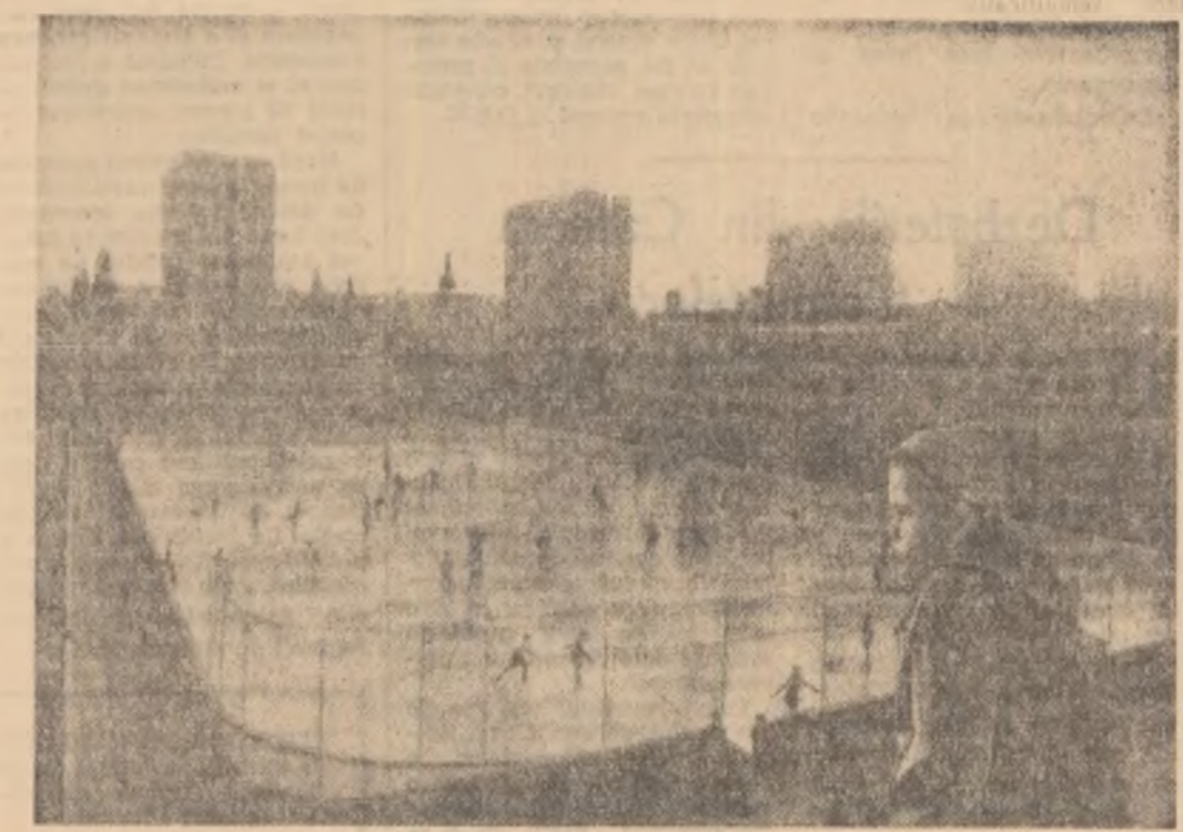
Pe patinoarul artificial „23 August” din Capitală și-au dat înfrîngere primii patinoari.

● În „Cupa cupelor”, la finalul Viena s-a disputat al treilea meci dintre echipele Olimpique Pireu și Zagreb (Varsavia). Echipa greacă a reușit victoria cu scorul de 2—0 (1—0). Echipa din Zagreb — M.T.K. Manchester United, Dinamo Zagreb și Budapesta — Fenerbahce-F.C. Linfield; (Agerpres)