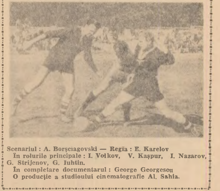
Scenariul: A. Borșciagovski — Regia: E. Karelov. În rolurile principale: I. Volkov, V. Kașpur, I. Nazarov, G. Strijenov, G. Iuhîn. În completare documentarul: George Georgesov. O producție a studioului cinematografic Al. Sahla.