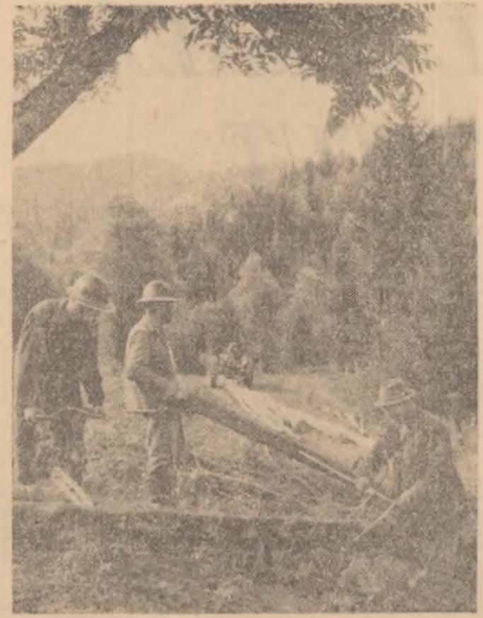
La poalele munților Căliman, aproape de defileul Mureșului, își desfășoară activitatea tăietorii parchetului Zebrac, din cadrul I. F. Toplija. Gradul de mecanizare ridicat și dotarea cu lierăstrăte electrice ușurează mult munca în parchete.

În prezent se fac pregătiri pentru aplicarea metodei de organizare a lucrului după graficul ciclic, care s-a dovedit deosebit de eficace în obținerea de randamente mari la înaintări și în alte locuri de muncă.