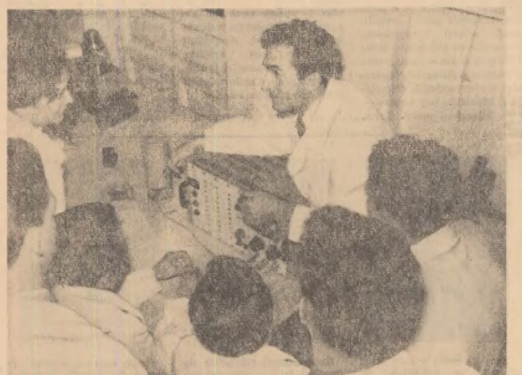
Tinerii din fotografie sînt studenți în anul III al Facultății de fizică din București. În laboratorul de fizică atomică sub îndrumarea asistentului — ei aprofundează cunoștințele căpătate la curs.