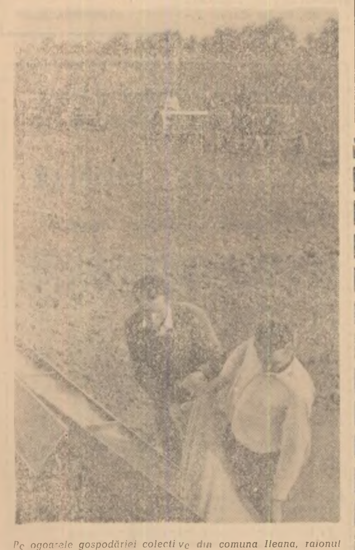
Pe ogoarele gospodăriei colective din comuna Ileana, raionul Lehtu, mecanizatorii însămînțează cu grîu ultimele suprafețe.