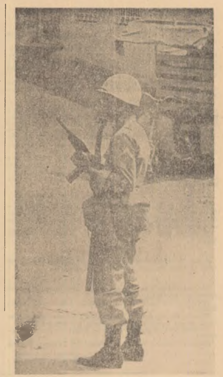
REPUBLICA DOMINICANĂ: Pe străzile capitalei, Santo Domingo trupele supraveghează circulația

Au început să funcționeze tribunalele militare care, o dată cu introducerea stării excepționale, au înlocuit tribunalele civile. La închisorile din Leopoldville și din împrejurimile orașului, unde sînt deținuți patrioți congolezi, a fost îndesrit regimul de detențiune.