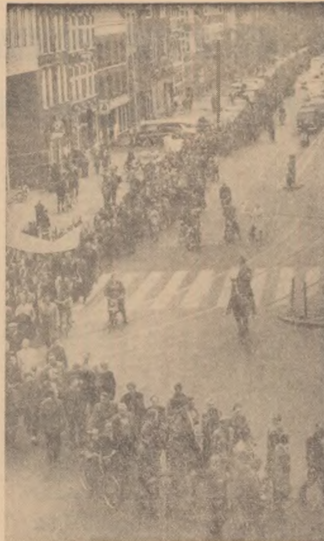
OLANDA. Lupta muncitorilor olandezi pentru sporirea salariilor s-a transformat într-o puternică acțiune de masă. În fotografie: Demonstrație a muncitorilor constructori din Amsterdam, în sprijinul revendicărilor lor

Tambo a cerut ca O.N.U. să adopte nerezitate sancțiuni economice împotriva R.S.A. pentru a pune capăt apartheidului.