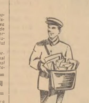
SĂULESCU ION — comuna Pirlita — raionul Lehiu

Pentru a urma cursurile unui institut de învățământ superior trebuie să aveți terminată școala medie de cultură generală cu examen de maturitate. Școala tehnică veterinară, absolvită de dumneavoastră, nu echivalează cu școala medie de cultură generală. Studii medii vi le puteți completa înscriindu-vă la cursurile fără frecvență sau