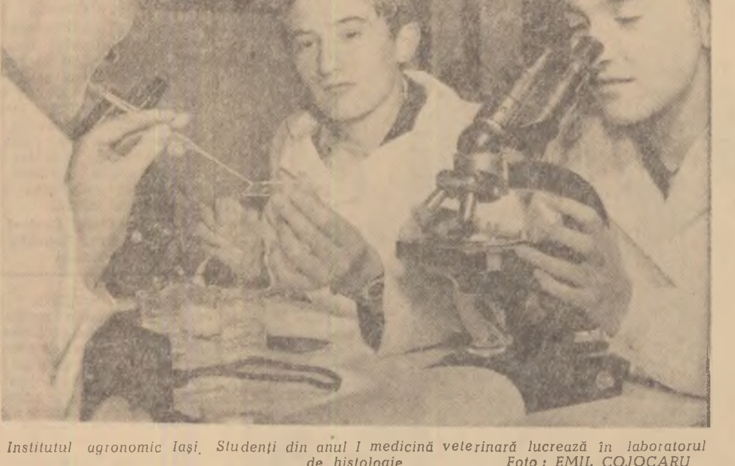
Institutul agronomic Iași. Studenți din anul I medicină veterinară lucrează în laboratorul de histologie.