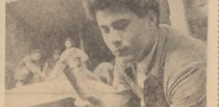
Unu din harnicii constructori

Și s-a făcut un plan bine alcătuit, în care s-a prevăzut intrarea în vacanță prin rotație, pe clase și pe grupe de elevi. De