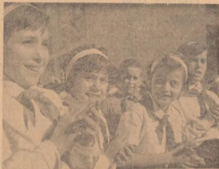
„In recreație”. Instantanee la Școala de 8 ani nr. 122 din București

Trăiască Partidul Muncitoresc Român, organizatorul și inspiratorul tuturor victoriilor noastre!”