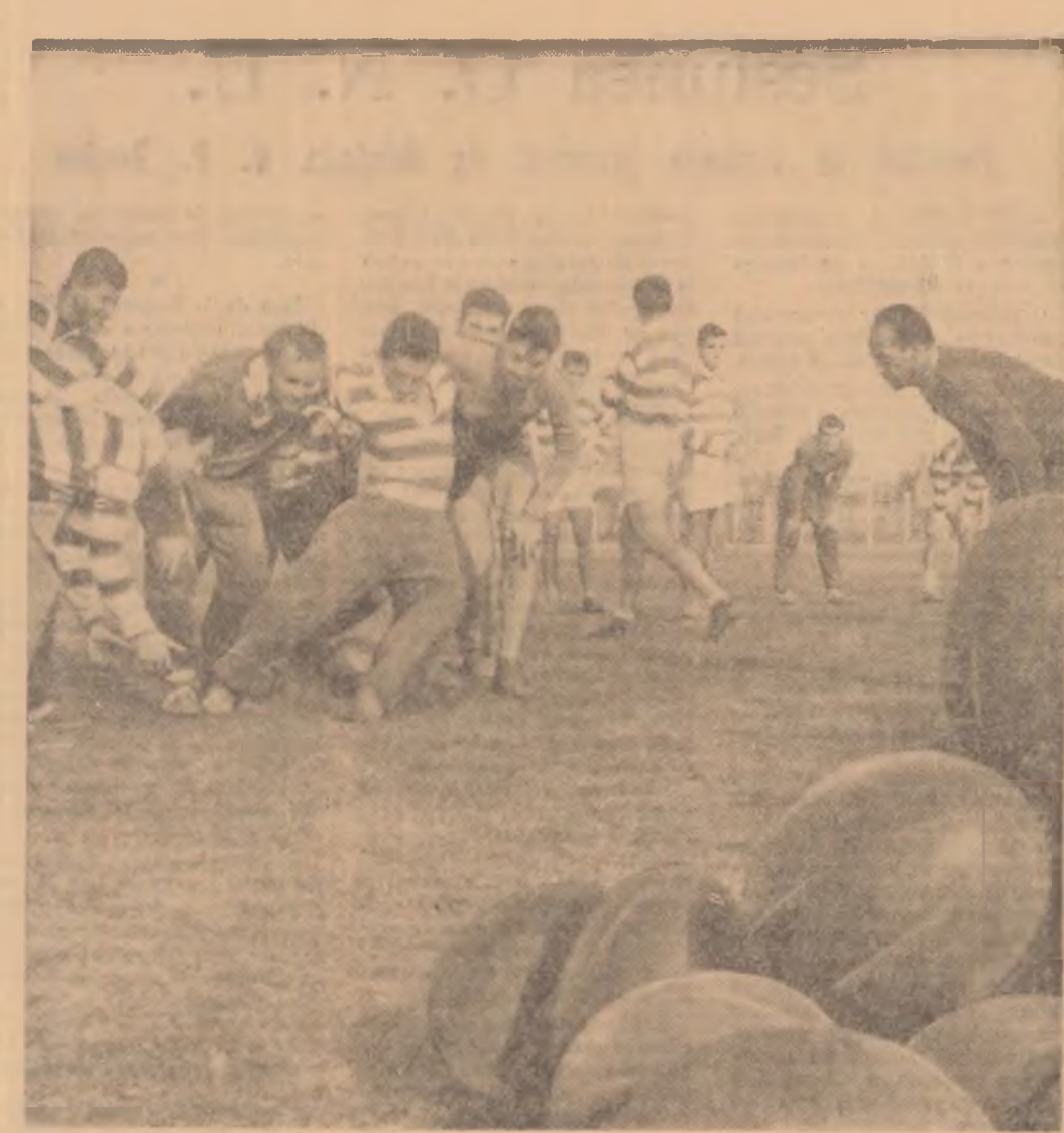
Iată-l pe cel 24 de tineri rugbiști la un antrenament.