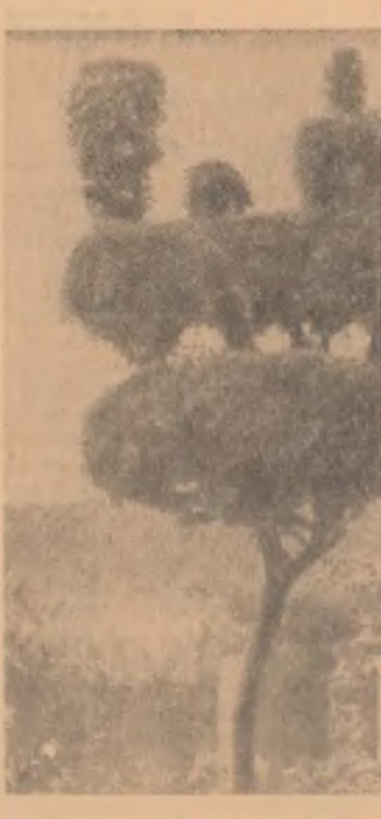
R. F. GERMANĂ. După multă trudă, un grădinar vest-german a reușit să dea unuia din pomii pe care îl îngrijește foarte bine locomotive supra-proizuse.

PARIS. — Compozitorul francez Darius Milhaud lucrează în prezent la o cantată avînd ca text enciclica „Pacem in terris” a Papei Ioan al XXIII-lea, pentru inițierea unei primei din cadrul unei audierii va avea loc la sfîrșitul anului în catedrala Notre Dame, cu ocazia ceremoniilor prilejuate de inaugurarea noii case a radiodifuziunii franceze. Darius Milhaud și-a ales de acum dirijorul în persoana lui Charles Munch.