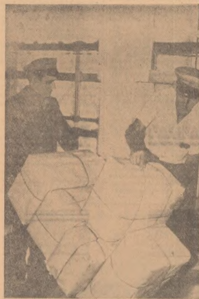
CUBA. Pe aeroportul „Jose Marti” se descarcă articolele de primă necesitate trimise de Uniunea Internațională a Studenților ca ajutor în legătură cu ravagiile uraganului „Flora”

BUENOS AIRES. — După cum transmite agenția France Presse, cea de-a cincea Cameră a Curții de Apel a Argentinei a hotărît să ceară extrădarea fostului președinte al Argentinei, Juan Domingo Peron, care se află în prezent în Spania. Potrivit agenției, vor fi întreprinse pe lângă guvernul spaniol demersuri în acest sens.