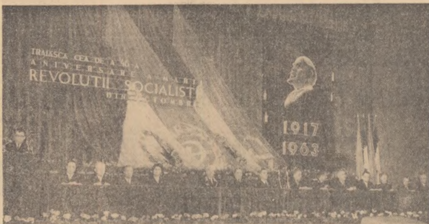
Prezidiul adunării festive